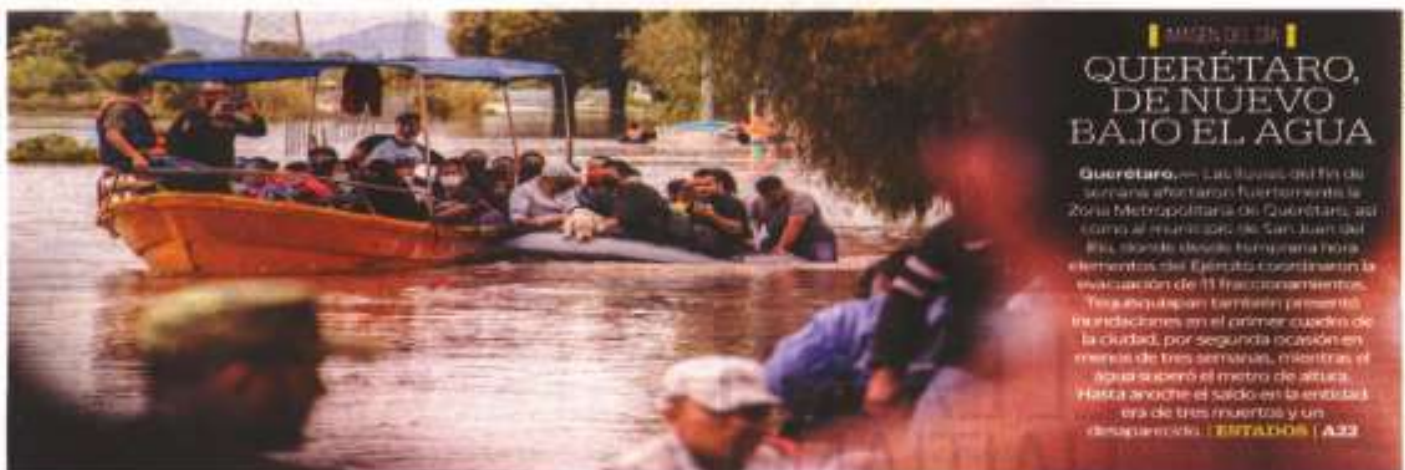
IMAGEN DEL DÍA QUERÉTARO, DE NUEVO BAJO EL AGUA

Querétaro.— Las lluvias del fin de semana ahorraron fuertemente la Zona Metropolitana de Querétaro, así como al municipio de San Juan del Río, donde desde temprana hora elementos del Ejército coordinaron la evacuación de 13 fraccionamientos. Tepehualtepec también presentó inundaciones en el primer cuadro de la ciudad, por segunda ocasión en menos de tres semanas, mientras el agua superó el metro de altura. Hasta anoche el saldo en la entidad era de tres muertos y un desaparecido. | ESTADOS | A32