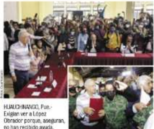
HUAUCHINANGO, Pue.- Exigían ver a López Obrador porque, aseguran, no han recibido ayuda.