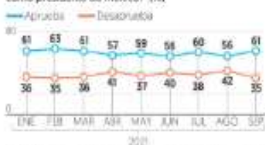
Nota: El gráfico muestra la evolución de las opiniones de los mexicanos sobre el trabajo de AMLO desde el inicio de su mandato en diciembre de 2018.

En general, ¿usted aprueba o desaprueba el trabajo que está haciendo Andrés Manuel López Obrador como presidente de México? (%)