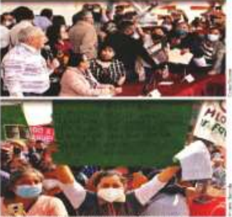
En Puebla, aficionados hincaron durante el descanso de AMLO para anunciar condiciones en caso de la liberación.

"Estamos en una situación como la de Pemex, apostando más en gastos de pensiones que en infraestructura", explicó.