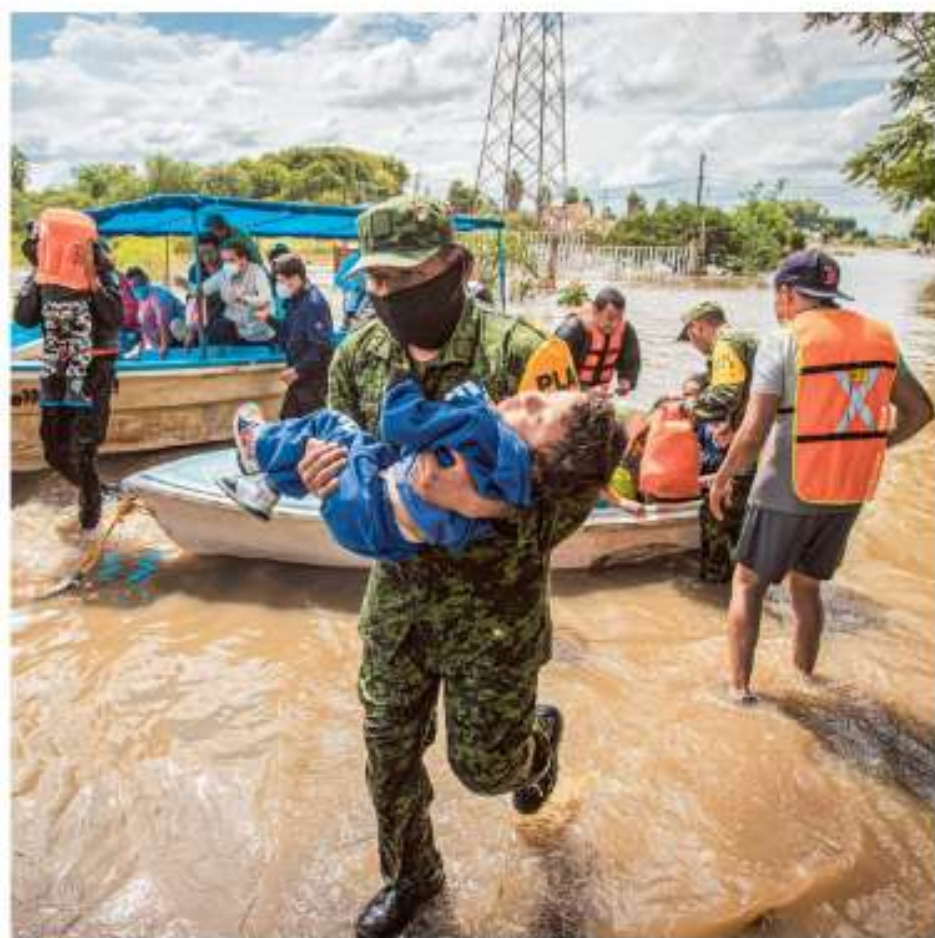
SENTREGUA. En San Juan del Río, Querétaro, Protección Civil estatal desalojó a más de mil 650 vecinos de colonias cercanas al río San Juan; en La Rueda, el agua creció hasta metro y medio ESTADOS P. 12

Manifestantes irrumpieron en evento de López Obrador en Puebla. Tras momentos de tensión en su equipo, el Ejecutivo tranquilizó a los inconformes, quienes lo escucharon. Militares escoltaron al mandatario en su retirada del auditorio. Los secretarios del Bienestar y de Seguridad atendieron a los inconformes MÉXICO P. 3