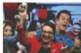
XIOMARA Castro, ayer, tras cierre de casillas.

Primeros datos del conteo dan 53.51% a Xiomara Castro, contra 34.05% del oficialista Nasry Asfura; sería la primera presidenta. pág. 10