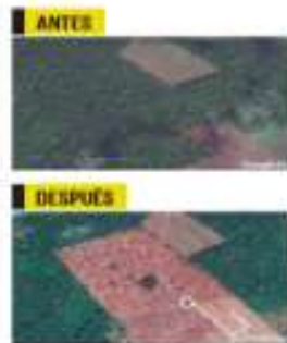
Los beneficiarios talan la selva para reemplazar las hectáreas de parcela que exige el programa.