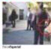
Un escóla armado en las instalaciones del CIDE, el jueves.