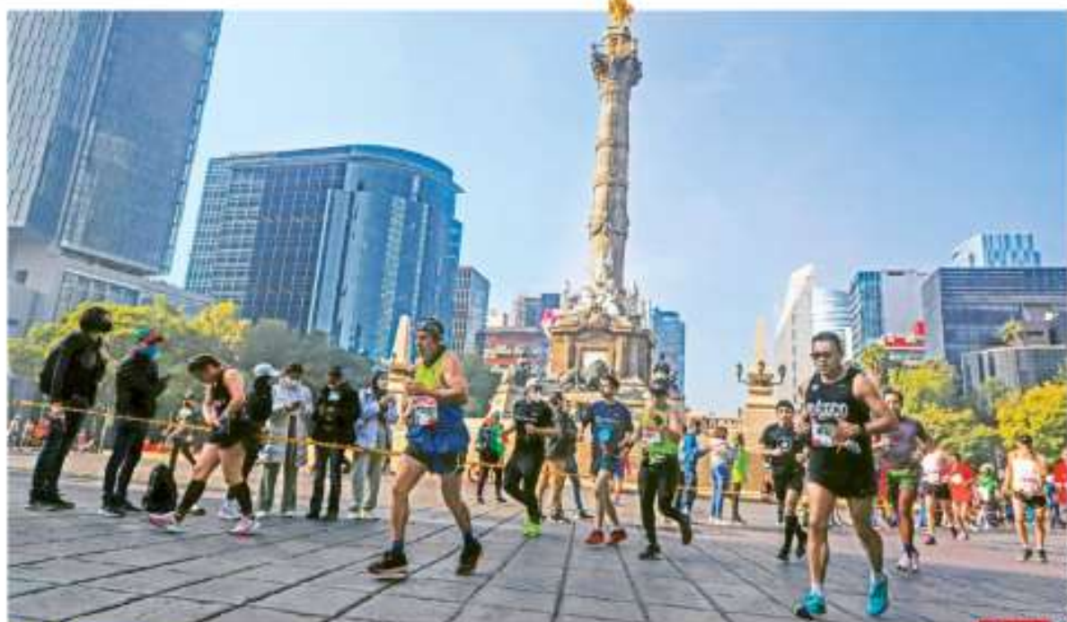
ALA VIVA MÉXICO. Más de 14 mil personas corrieron el Maratón de la Ciudad de México y la mayoría sin cubrebocas, en medio de la amenaza de una cuarta ola por Covid. Pasaron 12 años para que un mexicano ganara e incluso hicieron 1-2 CDMX Y OXTP. 9Y22