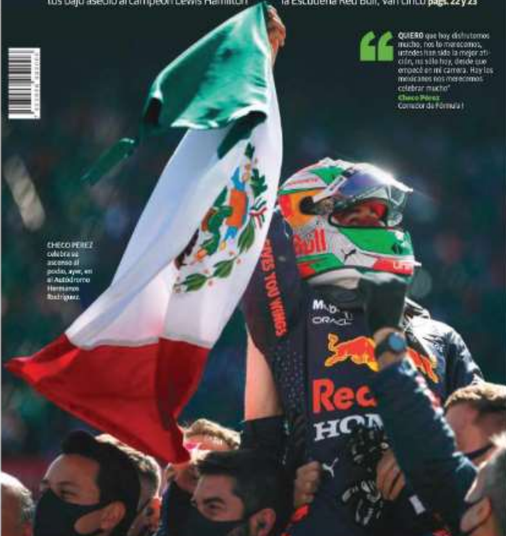
CHECO PÉREZ celebra su ascenso al podio, ayer, en el Autódromo Hermanos Rodríguez.

“ QUIERO que hay disfrutemos mucho; no lo menciono, ustedes han sido la mejor atención, no sólo hoy, desde que empecé en mi carrera. Hay los mexicanos nos merecemos celebrar mucho” Checo Pérez Corredor de Fórmula 1