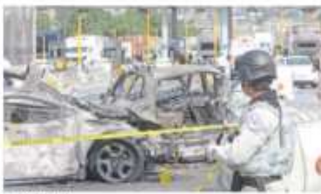
LAS A GARRIGA

Identificarán a las víctimas del accidente en la México-Puebla mediante ADN