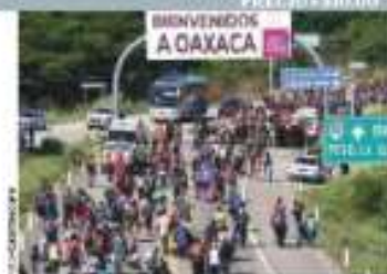
LA CARAVANA, al llegar a Los Corrales, Gaxaca, Jor.