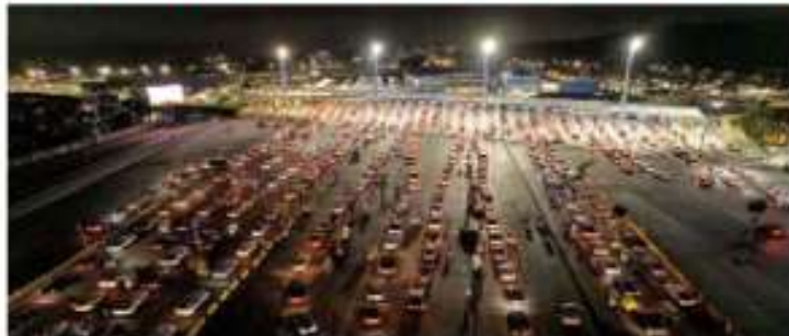
En la gente de San Ysidro, en EE, se observaron desde anoche largas filas de vehículos esperando.

Frontera (CBP, por sus siglas en inglés) recomienda que este tipo de cruces se lleven a cabo en horas no pico, es decir de lunes a viernes, de 9:00 a 19:00 horas, y los domingos de las 14:00 horas hasta la medianoche. PRIMERA | PÁGINA 6