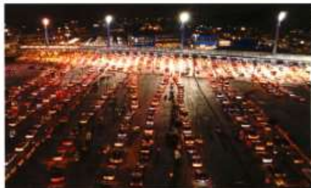
Larga fila de vehículos en frontera abierta en el lado mexicano de la frontera de Tijuana y San Ysidro, a la espera de que reanuden el paso para actividades no esenciales.

los similares del lado estadounidense, a fin de mantener las ventas por 60 mil millones de pesos que han tenido desde Tijuana, Baja California, hasta Matamoros, Tamaulipas, durante los 20 meses en que estuvieron cerradas las fronteras internacionales. ESTADOS | A22