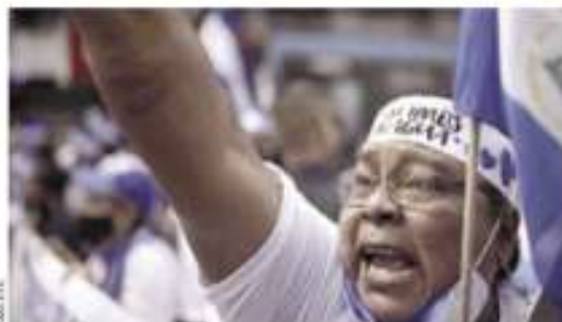
SAN JOSE, Costa Rica.- Nicaragüenses en el exilio protestan contra la reelección de Daniel Ortega.