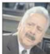
El político priista fue el primer titular de la Reforma Agraria.