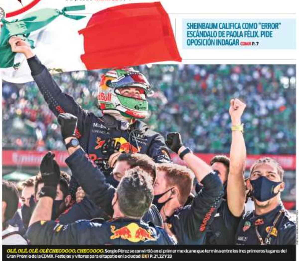
OLÉ, OLÉ, OLÉ, OLÉ CHECOOOO, CHECOOOO. Sergio Pérez se convirtió en el primer mexicano que termina entre los tres primeros lugares del Gran Premio de la CDMX. Festejos y vitores para el tapatio en la ciudad DXT P. 21, 22 Y 23