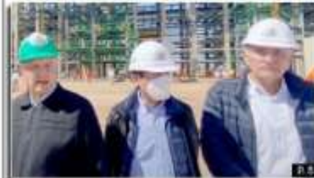
El presidente López Obrador, Rogelio Ramírez de la O y Edén Augusto López

Reinicia coquizadora en refinería de Tula