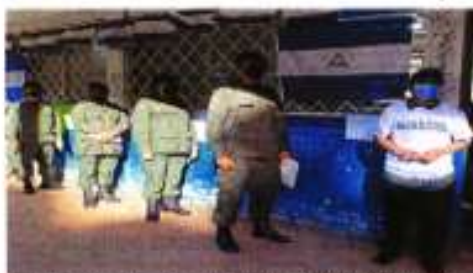
Ballot boxes investigated repeatedly after an error in Maragón para votar en las elecciones presidenciales.