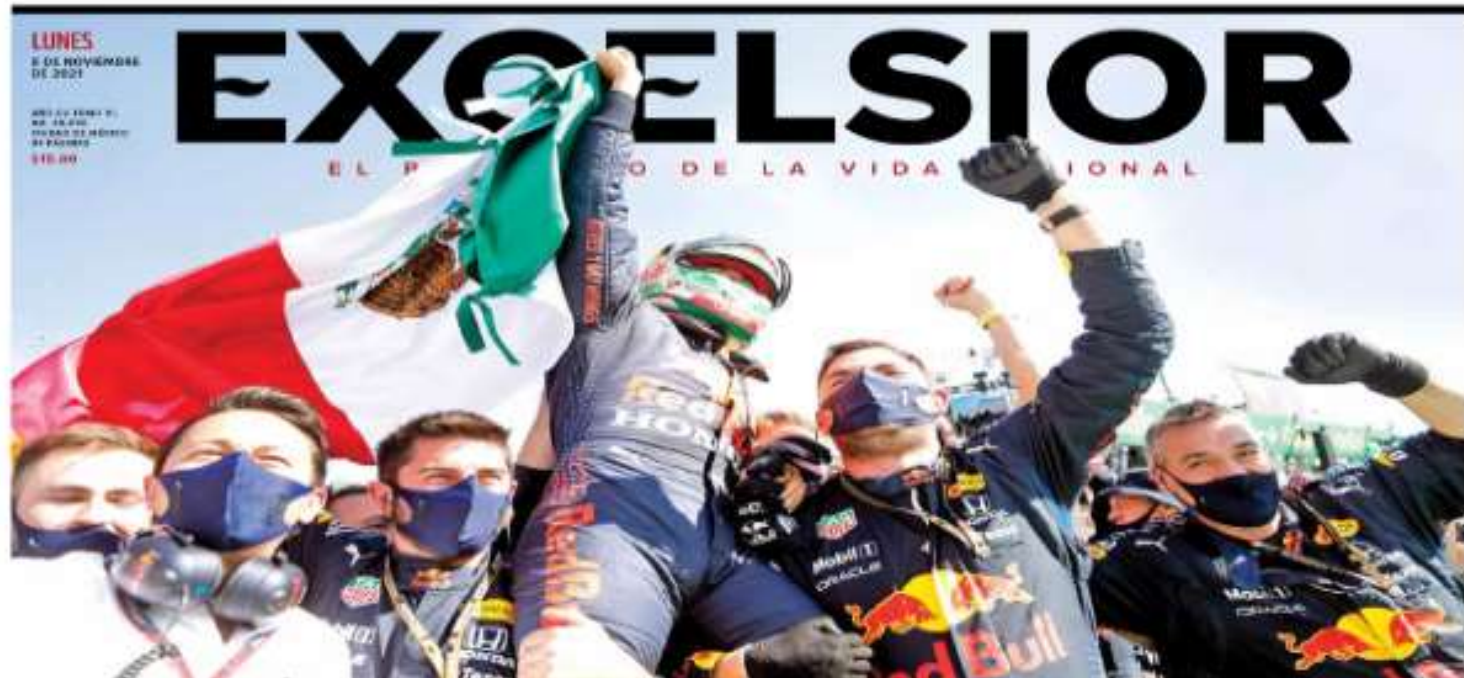
Checo Pérez terminó tercero en el GP de México y se convirtió en el primer piloto tricolor que sube al podio en una carrera de la F1 realizada en el país. Su compañero de equipo, Max Verstappen, se llevó el primer lugar.