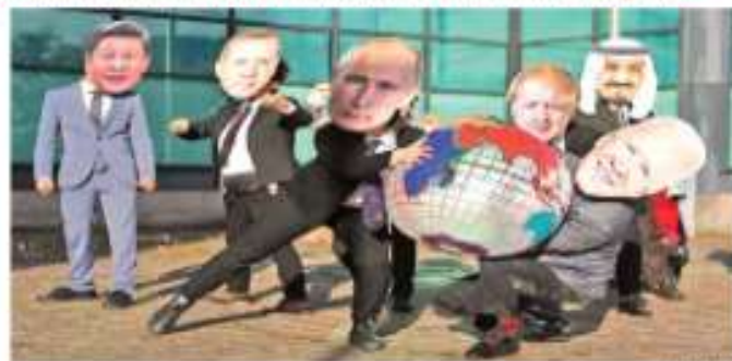
Activistas critican que la crisis climática parece ser un juego para los líderes mundiales.