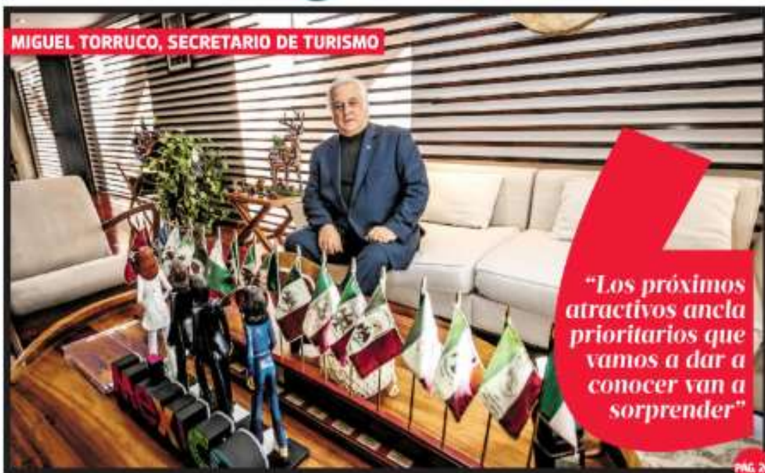
MIGUEL TORRUCO, SECRETARIO DE TURISMO

"Los próximos atractivos ancla prioritarios que vamos a dar a sorprender"