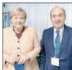
El ex presidente logró un "pese de cortesía" gracias a su ex titular de SRE. Aquí, con la canciller Angela Merkel.