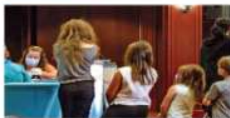
Seis niños de 5 a 11 años que acudieron a un hospital en Miami, Fla., con síntomas de fatiga, fueron los primeros en ser vacunados.