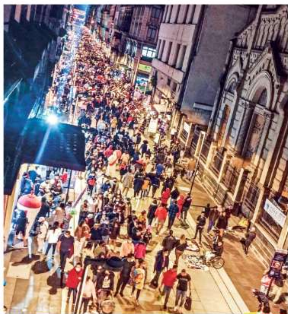
¿Y LA PANDEMIA? La calle de Madero, en el Centro Histórico de la CDMX, se convirtió en un verdadero río de personas que acudieron a la Gran Ofrenda en el Zócalo, que en tres días registró 800 mil visitantes. CDMX P. 9