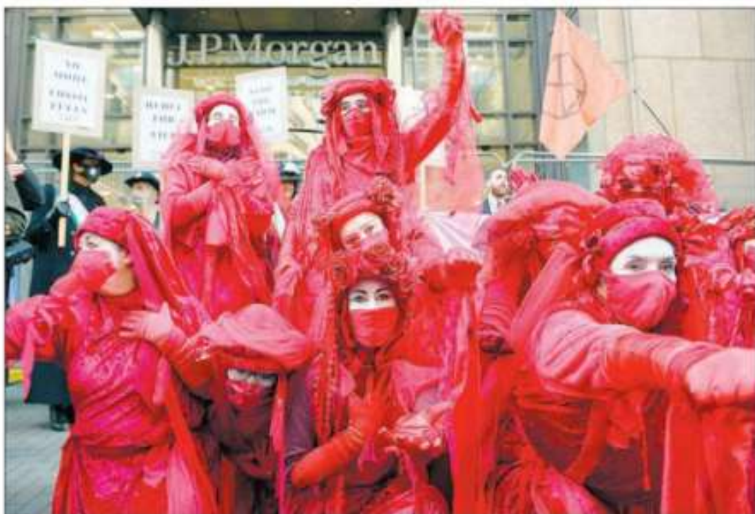
▲ Integrantes de la compañía de artistas Red Rebel Brigade se unieron a las manifestaciones frente a las oficinas del grupo financiero JP Morgan, en Glasgow, Escocia, para que se ponga freno al cambio