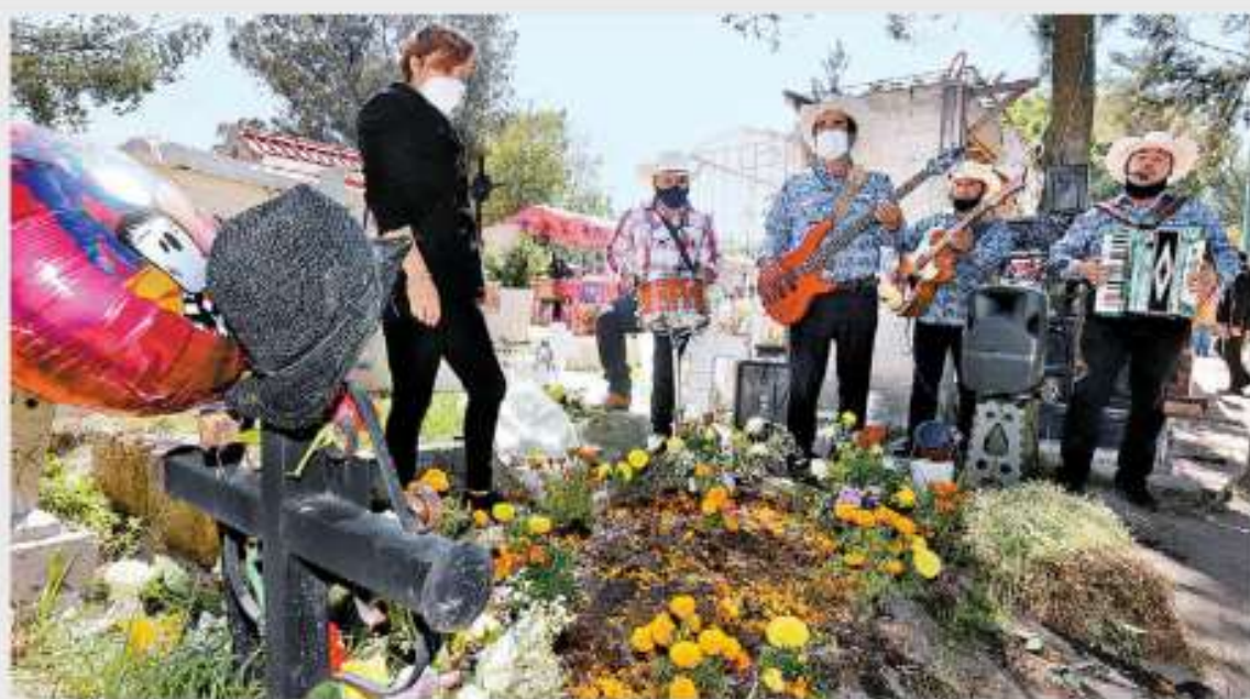
Música, flores, tragos, globos y hasta sombreros hubo en los honores a difuntos en los panteones de todo el país. JAVIER HÉROS