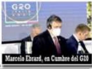
Marcelo Ebrard, en Cumbre del G20

"Financiamiento, clave para combatir cambio climático": Ebrard