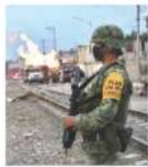
MILITARES, ayec, en la zona de la tragedia.

Un vecino que al cantado a huir narra que los sacaron a las 3 de la mañana, cuenta que fueron tres estallidos, otro dice que salieron rumbo al monte pág. 3