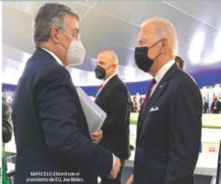
MARCELO Ebrard con el presidente de EU, Joe Biden.