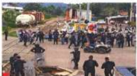
El bloqueo de las vías férreas en Michoacán ocurrió hasta que Morelia leuó la Gobernatura.

La anterior provocó que 704 trenes dejados de circular con 4 millones 813 toneladas principalmente de producción para la industria automotriz, suministrada para Pemex y diversos errores como ropa y aparatos tecnológicos, entre otros.