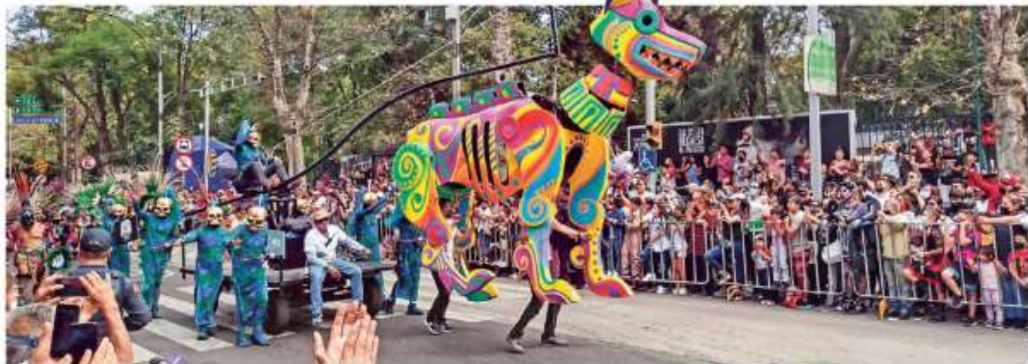
MATAN SANA DISTANCIA. CDMX revive tras pandemia: un millón de personas celebran con desfile de muertos. En Coyoacán, stand de El juego del calamar roba cámara CDMX P. 7, 8 Y 9

AUSENCIA DE RITUALES POR COVID ALARGÓ LA PENNA POR LA MUERTE