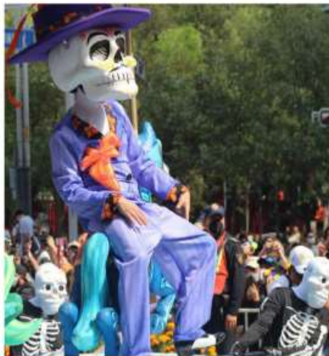
DESFILE DE DÍA DE MUERTOS

L a cumbre del G20 en Roma, la primera presencial desde 2019, abrió el domingo dos días un abanico de temas globales, desde el cambio climático hasta la pandemia de coronavirus, pasando por un impuesto de sociedades mundial. El secretario de Relaciones Exteriores, Marcelo Ebrard, informó que varios países respaldaron la decisión de México de generar un reconocimiento universal de todas las vacunas para combatir la pandemia. Asimismo, el secretario señaló que los miembros del G20 se establecieron como meta vacunar a 20% de la población mundial contra Covid-19 y sostuvo que, por ese motivo, es crucial la aprobación de todos los biológicos. Hasta el momento países como India, Indonesia y China han respaldado la propuesta del gobierno. Pág. 14