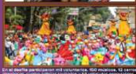
En el desfile participan más voluntarios, 150 músicos, 12 carros alegóricos, cuatro grupos musicales y 61 vehículos organizados.