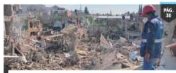
EXPLOSIÓN EN PUEBLA POR TOMA CLANDESTINA DE GAS INDAGAN A DOS IMPLICADOS; HAY 1 MUERTO Y 11 HERIDOS. PÁG. 30

finanzas públicas al 3T reveló que los ingresos totales aumentaron 5.6 por ciento en términos reales contra 2020. Los petroleros, 64.6 por ciento. — G. Castellanos / PÁG. 5