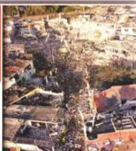
EL EFECTO. Casas y autos quedaron destruidos luego de tres explosiones subsiguientes en Xochimilco, Puebla.