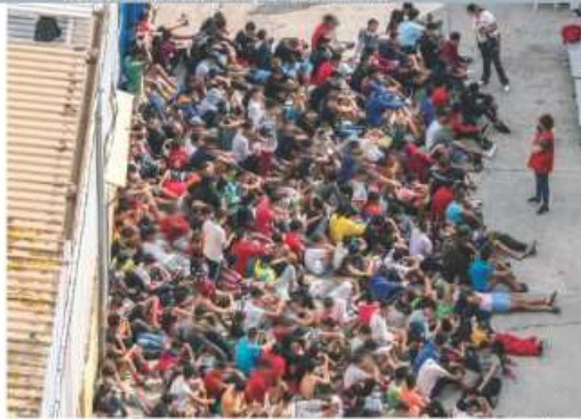
Crisis por niños migrantes solos en España

34 Factores que influyen en el caso Ocasio