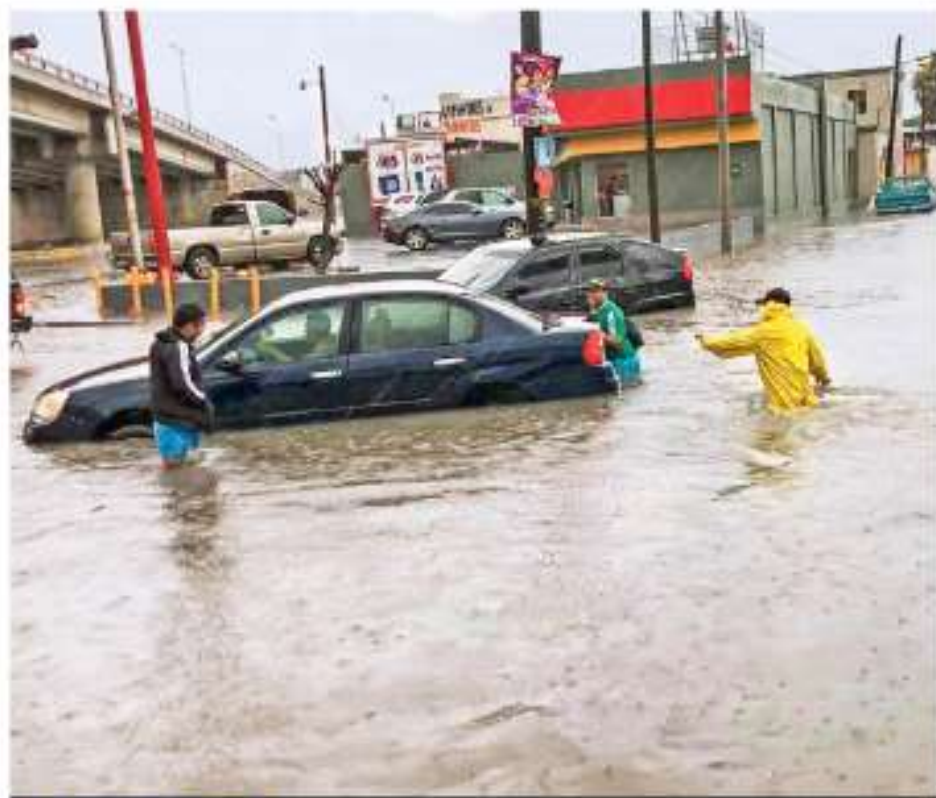
DILUVIO EN EL NORESTE. La tormenta que azotó ayer al amanecer a Reynosa, Tamaulipas, dejó severas inundaciones, autos bajo el agua, daños a inmuebles y a varias colonias sin luz. ESTADOS P. 12