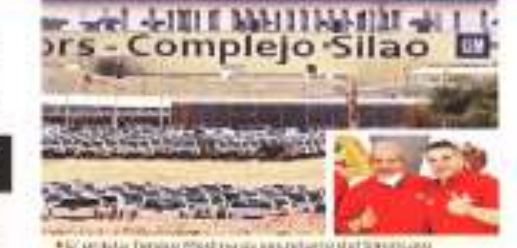
El complejo Toluca Petrolera es el resultado del convenio de 2003 y de Autocargas, alianza de la CTM desde 2003.

Piden aprovechar la amapola Dependencias mexicanas en México el uso médico de la producción de amapola. Hasta 2019, contra la distribución de opio que se hizo en el país, se usó el segundo y tercer lugar mundial en la producción de opio, el 60 por ciento de pacientes que requieren un morfiaco para tratar el dolor con dosis de medicamentos no tiene acceso a ellos. En 2019, se usó el 300 mil toneladas de opio en México, pero en 2020 se usó 9.7 millones de toneladas, lo que representa un aumento de 31 veces. Para 2021, México es el tercer país productor de opio en el mundo, con una producción de 1.2 millones de toneladas, lo que representa un aumento de 31 veces. En 2020, México adquirió 31 veces más morfina en la compra consolidada de medicamentos a través de la CDMX que en 2019.