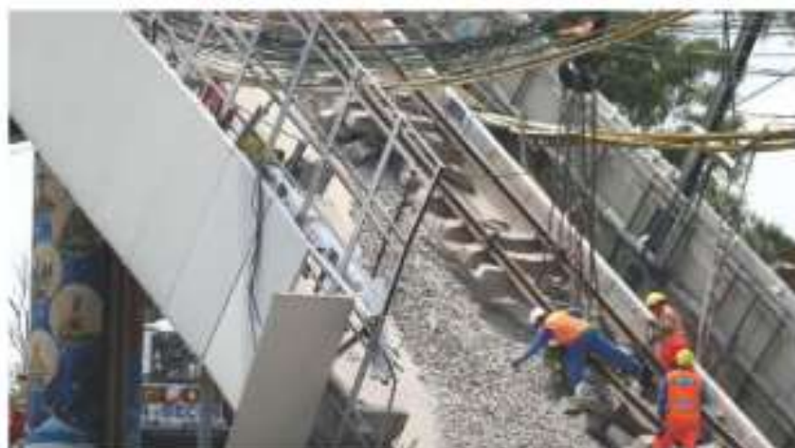
Trabajadores limpian el área del desmoronamiento.