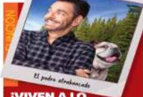
El padre abandonado