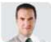
UIF lo propone como candidato del PRI en la estrategia de la Tarjeta Rosa a cambio del voto

UIF acusa a Samuel García de fondleos ilícitos; indaga a su esposa y a padres de ambos; sus partidos ven distractor y nerviosismo pág. 3