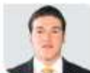
FISCALÍA a su presunta compra del voto a través de la Tarjeta Rosa; advierte que aminorará prisión oficiosa