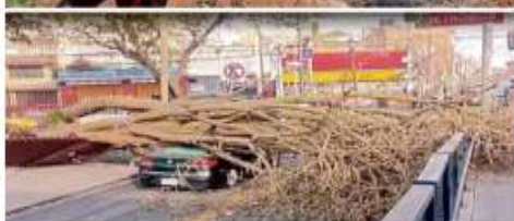
Rachas de vientos de hasta 60 kilómetros/hora en el Valle de México propiciaron caída de árboles y avance de incendios.