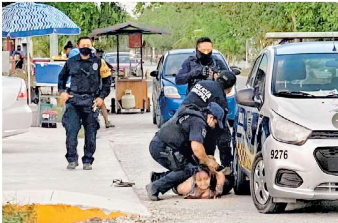
Uniformados del destino turístico mexicano fueron videograbados al momento de inmovilizar a la detenida.