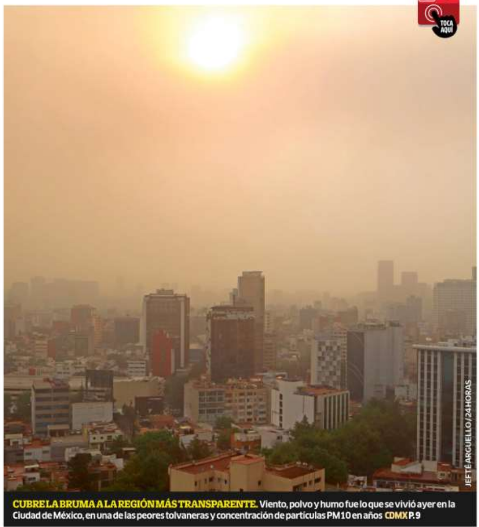
CUBRE LA BRUMA A LA REGIÓN MÁS TRANSPARENTE. Viento, polvo y humo fue lo que se vivió ayer en la Ciudad de México, en una de las peores tolvaneas y concentración de partículas PM10 en años CDMX P.9