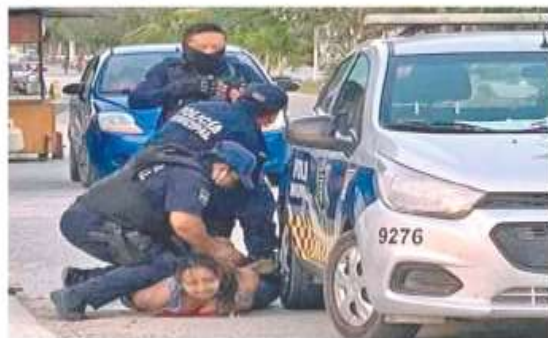
Videos dan cuenta de cómo una policía somete a la mujer, de origen salvadoreño, con una rodilla en la espalda y la deja inconsciente.

Autoridades, activistas y sociedad condenan el deceso de una salvadoreña en Tulum