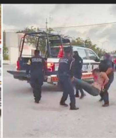
RAFAEL MARTINEZ / CORRESPONSAL