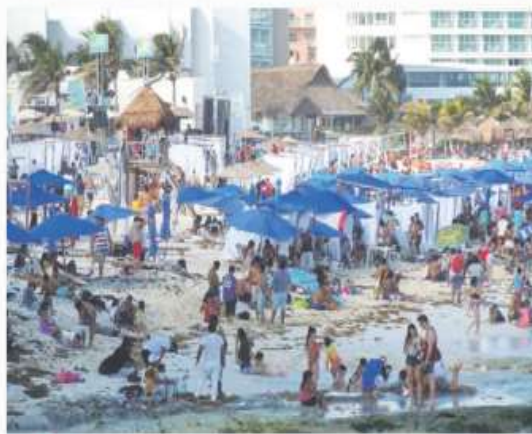
DESTINOS. Las playas de Quintana Roo, Guerrero y BCS son las predilectas.