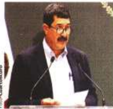
El gobernador Javier Corral.

ANDRÉS MANUEL LÓPEZ OBRADOR Presidente de México