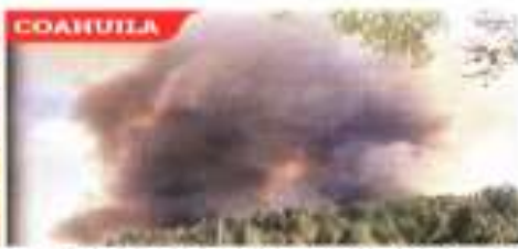
Incendios que el 11 de octubre se registró en la zona de San Mateo de Morelos y la Ciudad de México... PELUCO