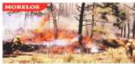
Incendios que el 11 de octubre se registró en la zona de San Mateo de Morelos y la Ciudad de México...

Y AMLO ARREMETE Antes, el Poder Judicial era como el castillo de la pueria...