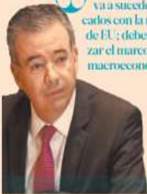
Alejandro Díaz de León, GOBERNADOR DEL BANCO DE MÉXICO.

No hay certeza de lo que va a suceder en los mercados con la recuperación de EU; debemos reforzar el marco de estabilidad macroeconómico".