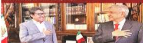
8 DE MARZO 2019

En marzo del 2019, AMLO y Ricardo Monreal desestimaron una propuesta del senador Salomón Jara para regular a las calificadoras, pero ahora el zacatecano y coordinador de Morena, cambió de opinión.