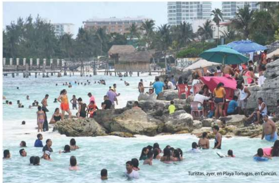
Turistas, ayer, en Playa Tortugas, en Cancún.

• Llega aforo hasta 80% en las de Sinaloa y Yucatán; turistas dejan a un lado la sana distancia y el uso de cubrebocas para evitar contagios pág. 6