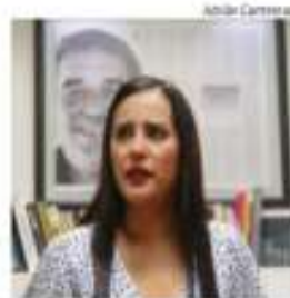
Visita Sandra Cuevas en Crónica.

Sorpresa. Sandra Cuevas logró derrotar a la maquinaria electoral de Dolores Padilla/Morena en la Alcaldía Cuauhtémoc de CD-MX. Lo hizo, asegura, a través de una propuesta diferente y no de supuestos apoyos subrepticios de morenistas como Ricardo Montiel. En entrevista con Crónica agrega que ganarle a ese partido, "del que sólo he recibido violencia", fue un enorme gozo. PÁG 16-17