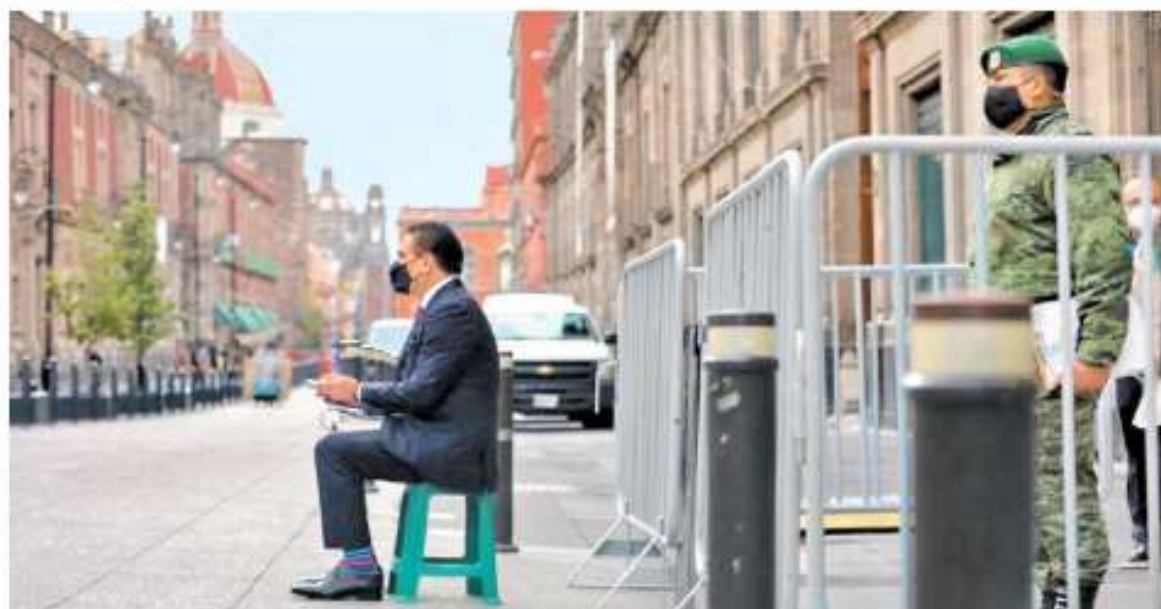
El mandatario acudió a mostrar "pruebas" de marcoelección, se dijo víctima de bullying y después de cuatro horas se retiró. OBTURADOR

Zvi Tal "La actitud ante Hamás, el gran desafío del nuevo gobierno israelí" - P. 15