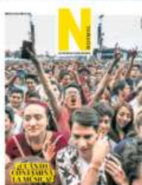
EL CASO GARCÍA Y CASASSA