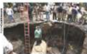
TRABAJO, ayer, en el socavón sobre Miramontes.

Suman 409 en 4 años con el de ayer por fuga de agua pág. 11