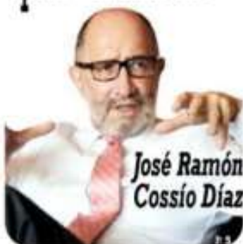
José Ramón Cossío Díaz

Alfaro paga 3 millones a exministro de la corte anti-AMLO por "asesoría"