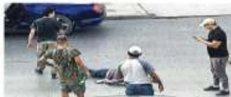
Al menos cuatro pistoleros fueron abatidos por policías en la jornada violenta del sábado.