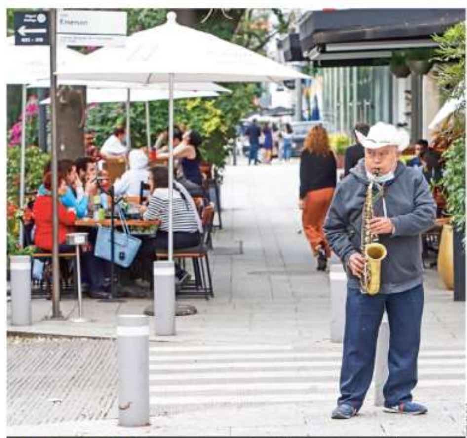
FESTEJO EN PANDEMIA. Mientras aumentan los casos activos de Covid-19 y 13 estados retrocedieron en su semáforo, el Día del Padre se vivió en parques y restaurantes; algunos no dejaron de trabajar. P. 4, 6, Y16