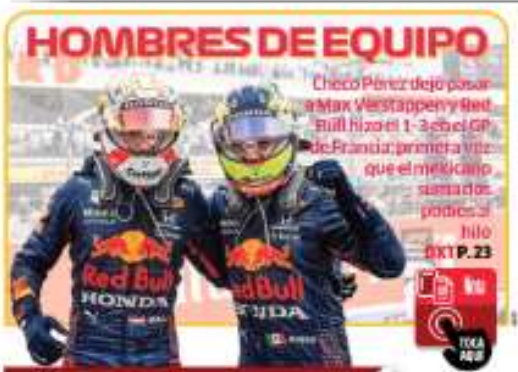
HOMBRES DE EQUIPO Checo Pérez dejó pasar a Max Verstappen y Esteban Ocon el primer lugar del GP de Francia; primera vez que el mexicano suma dos podios al hilo. SÍGUELO EN P. 23