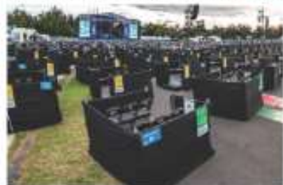
PALCOS, ayer, en el Autódromo Hermanos Rodríguez.

Vuelven a la ciudad conciertos masivos... pero en palcos; Ángeles Azules inauguran modalidad pág. 21