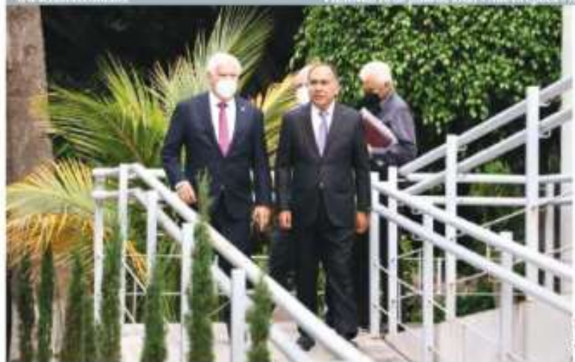
EL MANDATARIO de Guerrero (der.), con el secretario de Agricultura, ayer.