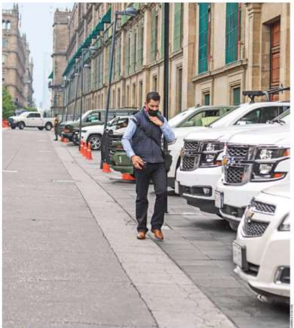
HAY LUGAR. De plano, los peatones dejan de transitar por la calle Corregidora cuando los invitados a Palacio Nacional estacionan sus camionetas sobre la banqueta.

Con la mudanza a Palacio Nacional de la residencia del Presidente y una parte de las actividades que se realizaban en Los Pinos, la histórica calle de Corregidora fue cerrada y convertida en estacionamiento de gobernadores y empresarios que visitan o acuden a reuniones de trabajo con el jefe del Ejecutivo. En la administración de Peña Nieto, éste llenó el Zócalo de coches... pero solo por un día MÉXICO P. 4