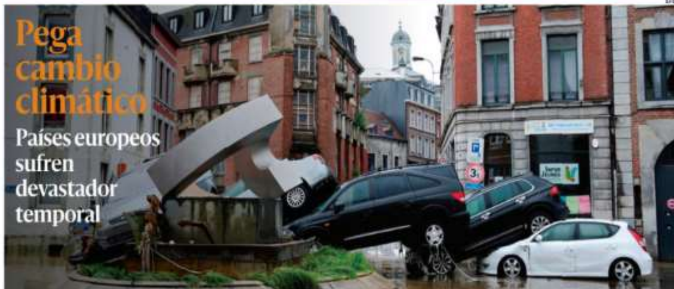
Las peores inundaciones del Siglo XXI en Alemania, Bélgica, Países Bajos, Luxemburgo y norte de Francia provocaron ayer al menos 69 muertos por culpa de deslaves que golpearon sobre todo la zona oeste del país germano. Hay, además, mil 300 personas desaparecidas. PAG 15

Países europeos sufren devastador temporal