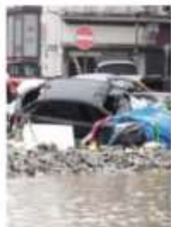
ALEMANIA.- Al menos setenta muertos, saldo de las lluvias en Europa. Ver página 12