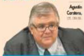
Agustín Carstens, G. 180 00

Se necesitan políticas monetaria y fiscal. Deben encontrar cómo incentivar la inversión y estimular la recuperación económica para tener crecimiento sostenible [...] el crecimiento grande es un híbrido de virus".