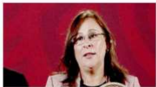
Rocío Nahle García