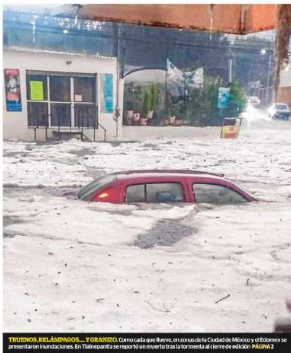
TRUENOS, RELÁMPAGOS... Y GRANIZO. Como cada que llueve, en zonas de la Ciudad de México y el Edomex se presentaron inundaciones. En Tlalnepanitla se reportó un muerto tras la tormenta al cierre de edición PÁGINA 2

Tras el anuncio de la Secretaría de Energía de otorgar a Pemex el control de un yacimiento descubierto por Talos Energy, la firma se dijo "decepcionada" e informó de posibles acciones legales por la medida. El descubrimiento del campo petrolero en 2017 por la firma estadounidense fue posible por la Reforma Energética de EPN, pero el gobierno de AMLO terminó con las asociaciones con privados. Talos redujo su inversión en México de 2019 a 2020 en 79% NEGOCIOS P. 17