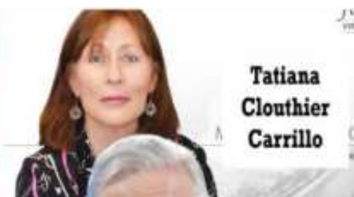
Tatiana Clouthier Carrillo