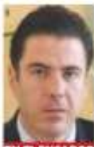
EN EL ENCARGO

Otros cargos: Director General de Seguridad Privada, creador del Servicio de Protección Federal y coordinador de Inteligencia para la Prevención del Delito.