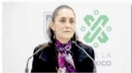
Claudia Sheinbaum Pardo