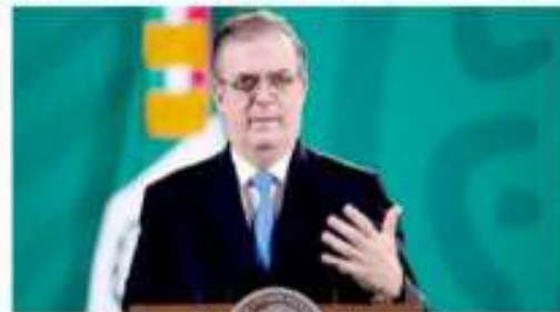
Marcelo Ebrard Casaubón