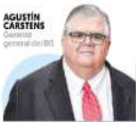
AGUSTÍN CARSTENS Gerente general del BIS

tomen medidas extraordinarias, pues la inflación que se registra en muchos lugares no tiene componentes monetarios, sino que son factores de oferta que desaparecerán con el tiempo. —Enrique Quintana / PÁG. 4