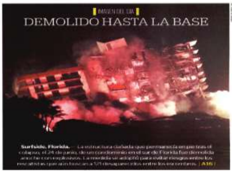
Surfside, Florida. La estructura dañada que permanecía en pie tras el colapso, el 29 de junio, de un condominio en el sur de Florida fue demolido con un explosivo. La rescoldada se utilizó para evitar riesgos entre los residentes que aún viven en a 500 viviendas más en la zona. [ A16 ]

En los últimos, el primer coordinador del tractor en la Cámara de Diputados, dijo que no solo muestra los puntos verdes por las reformas. Señaló que algunos votos no modificaron fuerza que ya se ponían de acuerdo con la ideología del tractorista. [ NACIÓN | A6 ]