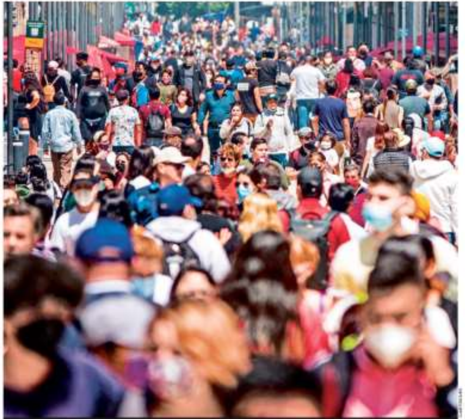
COMO SINADA. En la calle Madero, en el Centro Histórico de la Ciudad de México, miles de personas pasearon ayer como antes de la pandemia de Covid-19, en medio de un aumento de casos de forma constante en la capital.

DAN ÚLTIMO ADIÓS A POLLY; FEMINISTAS PIDEN JUSTICIA CDMX P. 7