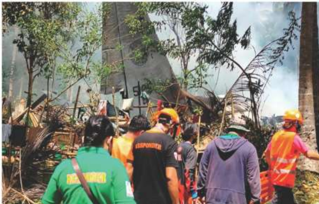
LABORES de rescate, ayer, en la aeronave militar estrellada en Joló, Filipinas