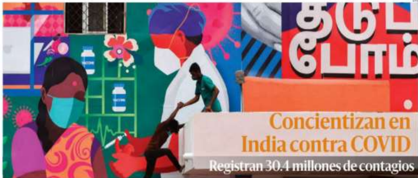
Trabajadores indios dan los toques finales a un enorme mural realizado en una pared de la estación de tren en Chennai, para promover la importancia de la vacunación contra la COVID-19. El gobierno de India confirmó el fin de semana 400 mil muertes, la mitad de ellas en los dos últimos meses.