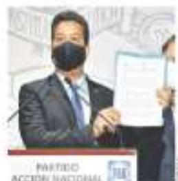
PARL. Vigilancia de obra el proceso de desahucio del gobernador.