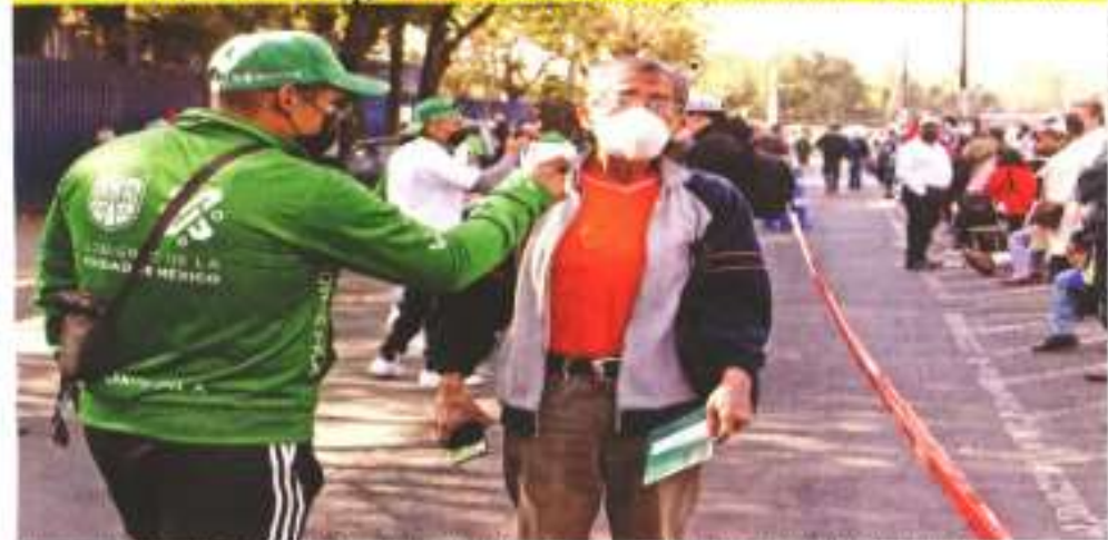
Adulterio empresas acobardadas a la Secretaría de Salud en Jalisco, una de las secretarías de vacuación.