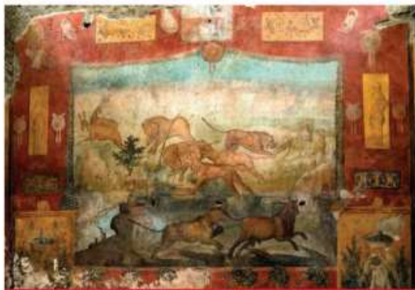
Expertos del Parque Arqueológico de Pompeya mostraron ayer un fresco de grandes dimensiones recuperado en la ciudad de Pompeya, el cual muestra escenas de caza y paisajes egipcios de la delta del río Nilo. La obra está en el jardín de la casa de un magistrado de la Antigua Roma.

RECUPERAN EN POMPEYA FRESCO CON PAISAJES EGIPCIOS