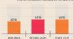
Gráfico en porcentajes

SE DISPARAN COMPRAS POR INTERNET ENTRE ABRIL DE 2020 y enero de 2021 aumentó 8% el e-commerce.