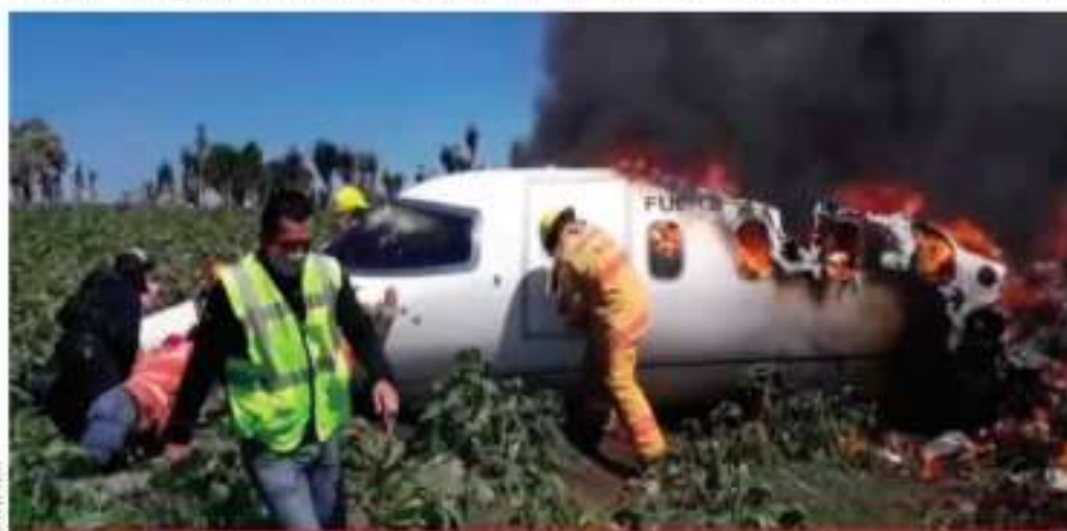
Un Learjet 45 de la Fuerza Aérea Mexicana se desplomó para después incendiarse; había despegado del aeropuerto El Lencero, ubicado en el municipio de Emiliano Zapata, Veracruz. La Secretaría de la Defensa Nacional informó que perdieron la vida seis militares.