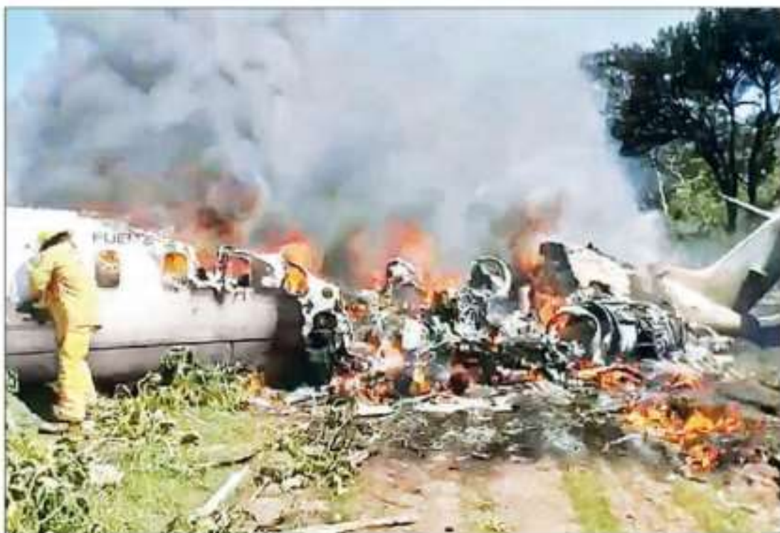
▲ La aeronave Learjet 45XR, perteneciente a la Fuerza Aérea Mexicana, se desplomó al intentar despegar de la terminal ubicada en los límites con Xalapa, Veracruz. Los informes de la Secretaría de