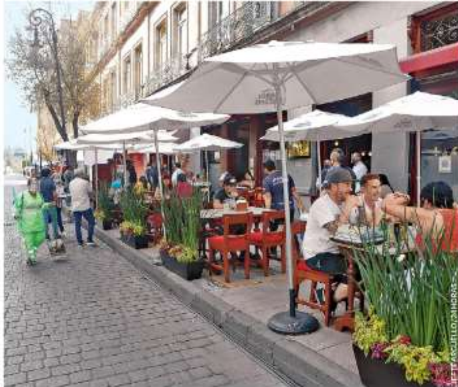
REVIVE EL CENTRO EN NARANJA. Las calles de Madero y 5 de Mayo se llenaron de gente como en los tiempos de antes de la pandemia, en un Semáforo Naranja que pareciera verde. Hoy los restaurantes podrán aumentar su aforo mientras que en plazas comerciales se realizan pruebas Covid CDMX P. 7