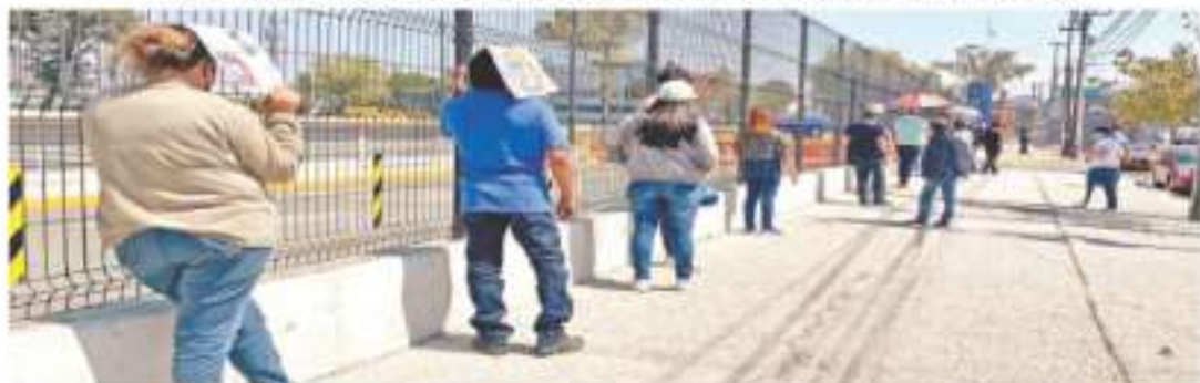
CDMX. — Pese a que las autoridades anunciaron que 10 plazas comerciales, tiendas departamentales y 42 farmacias privadas se sumaron ayer a realizar pruebas de Covid, sólo se hicieron tres lugares, uno de los cuales fue la plaza Parque Via Valles, donde la gente esperó más de 4 horas para hacerse el análisis. | METROPOLI | A19