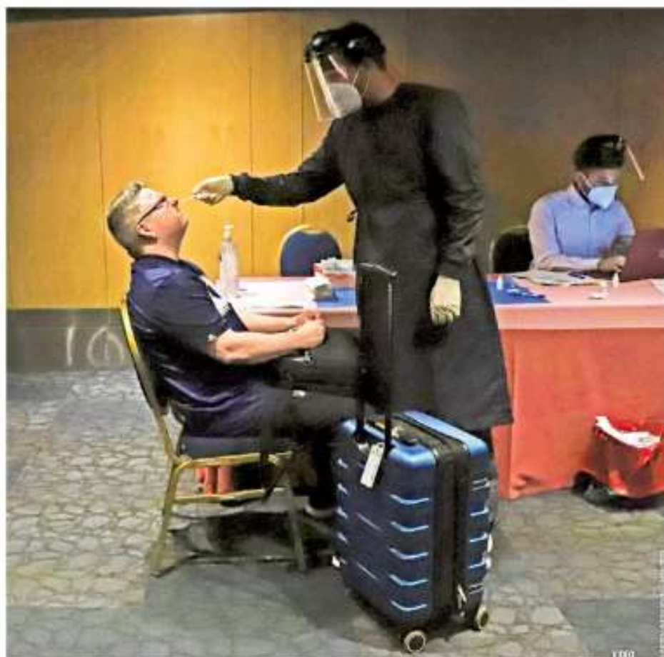
REINA CONFUSIÓN EN EL ASICM. Pese a la instalación de módulos para realizar pruebas Covid en el aeropuerto, persiste el caos entre viajeros que van a EU, quienes se han visto obligados a retrasar sus vuelos. MÉXICO P. 3