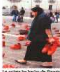
La artista ha hecho de Zapopan su espacio de acción.

"Vivimos una pandemia de feminicidios hace 30 años, ¿cómo es posible que el gobierno no haga nada, que siga siendo parte del problema y no de la solución?"