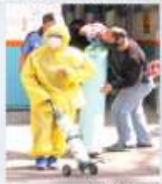
Foto: Inegi/Instituto de Estadística y Geografía. Un trabajador protegido, un equipo listo para recoger su trabajo.