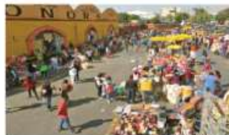
Los ambulantes se instalan en el estacionamiento del centro de Alonso. Si no van a laborar, también deben pagar cuota, afirman.