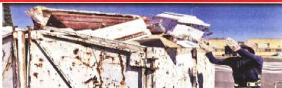
En el panteón municipal de Nezahualcóyotl, en Edomex, diariamente una montaña de residuos se desmenua, los residuos van a un contenedor de basura y los restos a la fosa común. Los residuos vuelven a ocuparse con muertos por Covid.