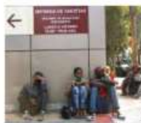
INDOCUMENTADOS, en espera de su visa humanitaria en el INM, ayer.

ANTICIPA presiones en fronteras norte y sur por nuevos arribos y Quédate en México; este año, con aumento de 300% en peticiones de asilo: SRE pág. 3