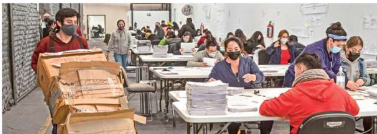
¡FIRMA POR FIRMA! El Poder Judicial definirá si se realiza o no la revocación de mandato, mientras personal del INE contabiliza millones de papeletas, para lo cual gastará 8.1 mdp. P. 4