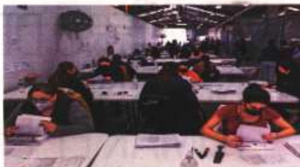
Personal del INE revisa y valida las firmas recolectadas para que se lleve a cabo la consulta de revocación de mandato impulsada por el presidente López Obrador.

Por el rechazo de los partidos de oposición, ayer el presidente de la Cámara de Diputados, Sergio Cárdenas Lara, presenció ante la Suprema Corte de Justicia de la Nación una controversia constitucional contra la declaración del INE de suspensión por falta de recursos, la comisión sobre revocación de mandato. Por su parte, Morena llevó ante el Tribunal Electoral una impugnación por el mismo motivo. | NACIÓN | A4