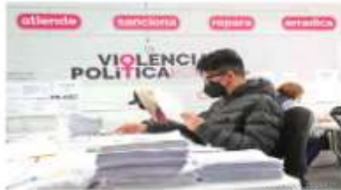
Fotografía del INE muestra relaciones de fuerza de candidatos electorales que respaldan las solicitudes de revocación de mandato.

La representación de Morena ante el INE también