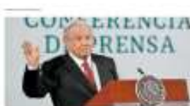
Recompensas por narcos Asunto interno, la captura de hijos del Chapo AMLO

La agencia antidrogas estadounidense ha incautado 20 millones 400 mil pastillas de falsos fármacos durante este año, de las que se ha sabido que cuatro de cada 10 contienen dos miligramos de fentanilo, una cantidad que se considera letal. PÁGS. 6 Y 7