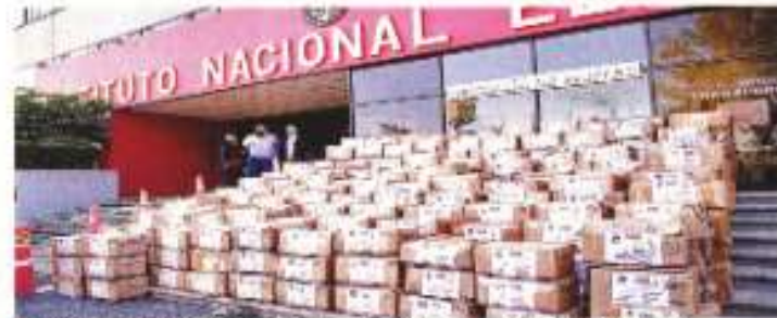
La secretaría "Que siga la Democracia" entregó ayer al INE un millón 600 mil firmas para apoyar la consulta. En total, algunas que son entregadas 3.3 millones. La ley establece que se requieren al menos 2.7 millones para que se realice el proceso.

"Esta, derivada del recorte presupuestal aprobado por la Cámara de Diputados al INE para el ejercicio 2022,