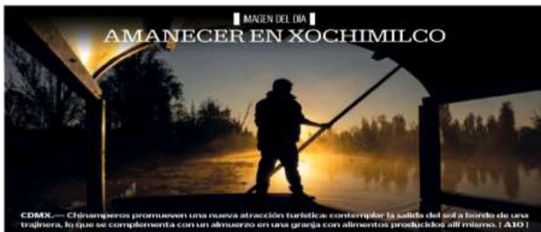
CDMX.— Chínamperos promueven una nueva atracción turística: contemplar la salida del sol a bordo de una trajinera, lo que se complementa con un almuerzo en una granja con alimentos producidos allí mismo. | A10 |