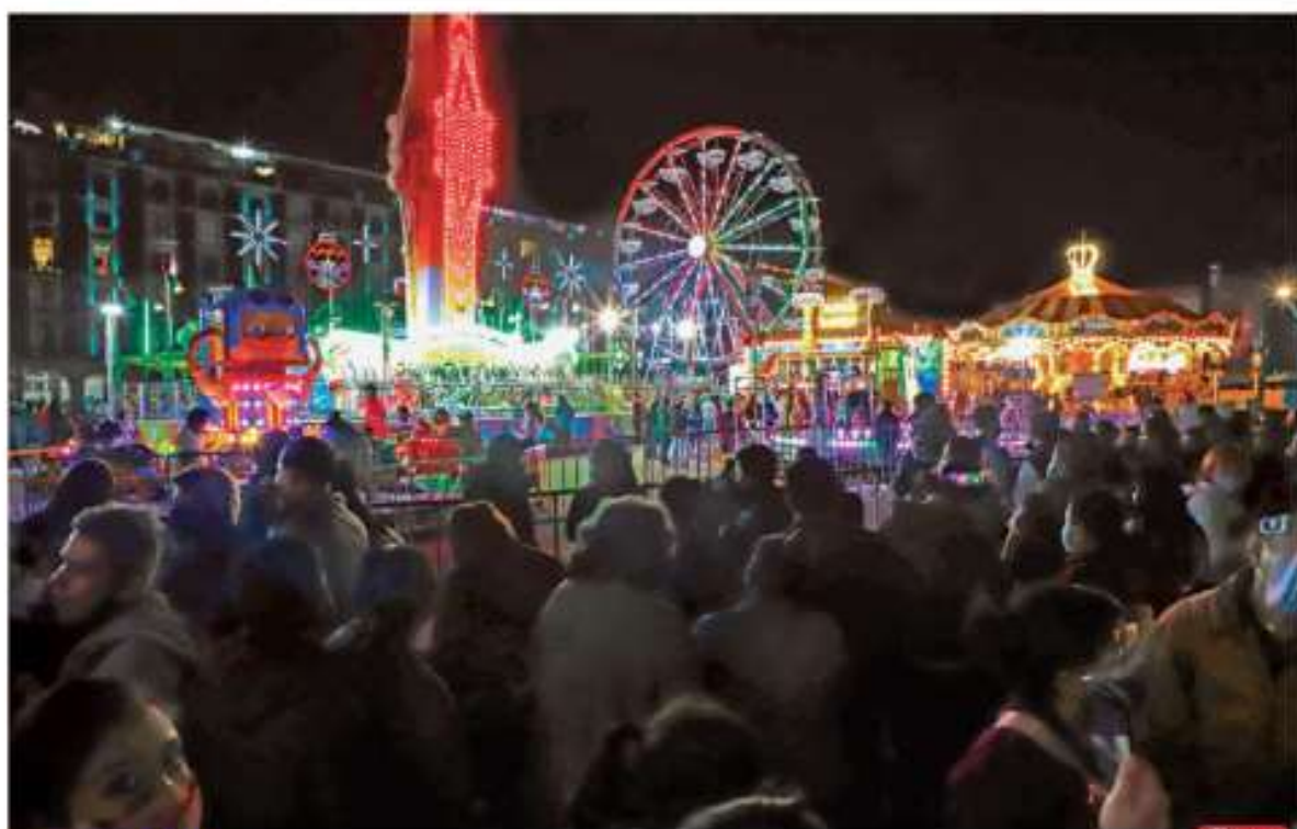
FERIA EN EL ZÓCALO. Hoy se inaugura la verbena en la Plaza de la Constitución con juegos mecánicos y otras amenidades. Sin embargo, desde ayer cientos de capitalinos abarrotaron el primer cuadro, muchos de ellos, sin cubrebocas.