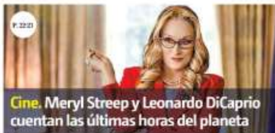
Cine. Meryl Streep y Leonardo DiCaprio cuentan las últimas horas del planeta

Lucía Hiriart, viuda de Augusto Pinochet y mano derecha del dictador durante la época de represión en Chile después del golpe a Salvador Allende, murió ayer a los 99 años.