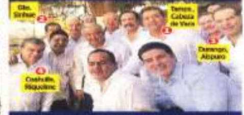
La Alianza Progresista creó un grupo de 2000 por gobernadores prietas y unidades cuestionadas en febrero pasado a AMLO por lo que llamó "hermandad política" contra opositores. Ante las gubernaturas, de los Aliados que son aliados en el campo, se abordan al mandato del Presidente y reiventaron la Campaña con un llamado a la unidad.