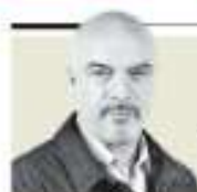
Carlos Puig "Virus de 2022: el anticipado juego de las corcholatas" - p. 2