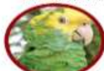
Lara de más aserillo. Está presa en donde México hasta Costa Rica.