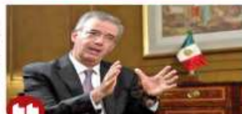
Ha sido muy claro nuestro objetivo: mantener una inflación baja y estable; creemos también que el perímetro constitucional del banco es muy adecuado y merece la pena conservarlo.

La inflación, agregó, es una enfermedad del dinero que perjudica, sobre todo, a