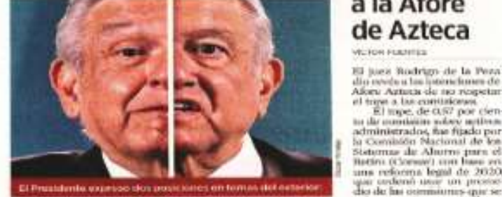
El Presidente expuso dos posturas en temas del exterior.

ANTE PERÚ Apoyo con vacunas y combates y envío de funcionarios para apoyar al Presidente Pedro Castillo ante amenazas internacionales de derrocamiento.