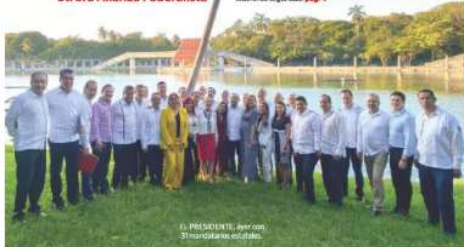
EL PRESIDENTE, ayer con 31 mandatarios estatales.

A REUNIÓN a la que asistió el Presidente sólo falta Alfaro, por vacaciones; acuerdan cenar filas en torno a estrategia federal de seguridad. pág. 4