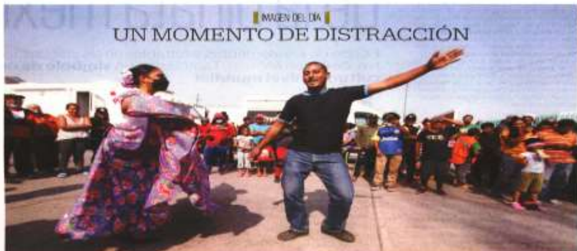
IMAGEN DEL DÍA UN MOMENTO DE DISTRACCIÓN

Los migrantes que se encuentran en la Casa del Peregrino San Juan Diego recuperan fuerzas para seguir su camino hacia Estados Unidos y agradecen las atenciones que han recibido en la Ciudad de México, luego de dos meses de caminatas, malos tratos y vejaciones. Ayer un ballet folclórico hizo bailar a centroamericanos y haitianos. | METROPOLI | A12