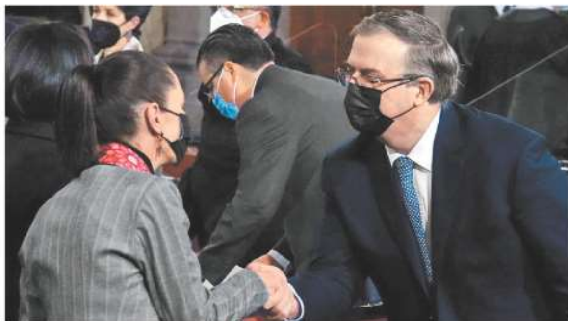
La jefa de Gobierno y el titular de Relaciones Exteriores durante el tercer informe del ministro.