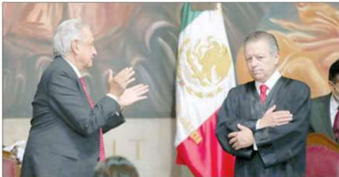
▲ Arturo Zaldívar, titular de la Suprema Corte de Justicia de la Nación, presentó su informe anual de labores. En el acto estuvieron presentes el presidente Andrés Manuel López Obrador y representantes del Congreso de la Unión.