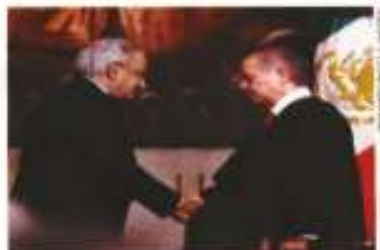
El presidente López Obrador asistió al informe del actual presidente de la Corte, Arturo Zaldívar.