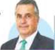
JULIO SANTAELLA Presidente saliente del INEGI

"...nos damos un 'tú a tú' con las mejores instituciones estadísticas"