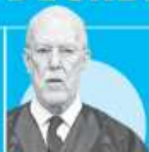
JUAN LUIS GONZÁLEZ ALCÁNTARA

"Creemos que es un paso importante en materia de transparencia y acceso a la información..."