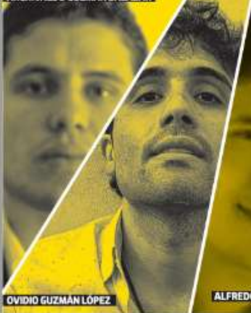
OVIDIO GUZMÁN LÓPEZ