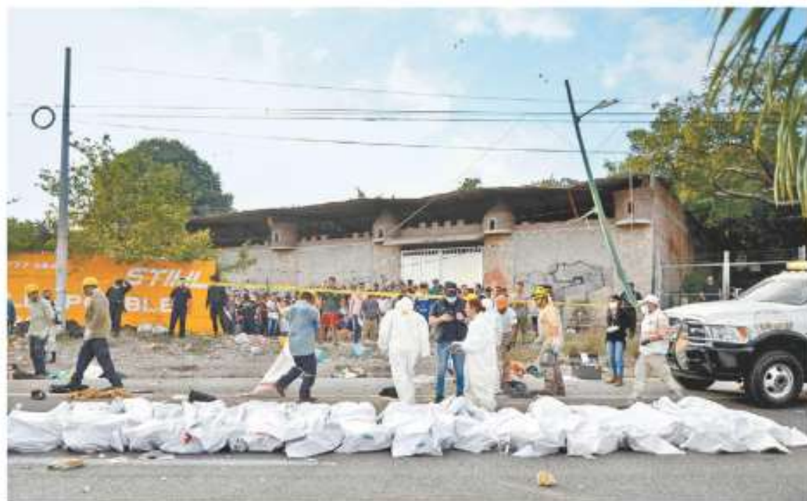
Expresiones de duelo han llegado desde diversos países y Guatemala se declaró listo para repatriar cuerpos.