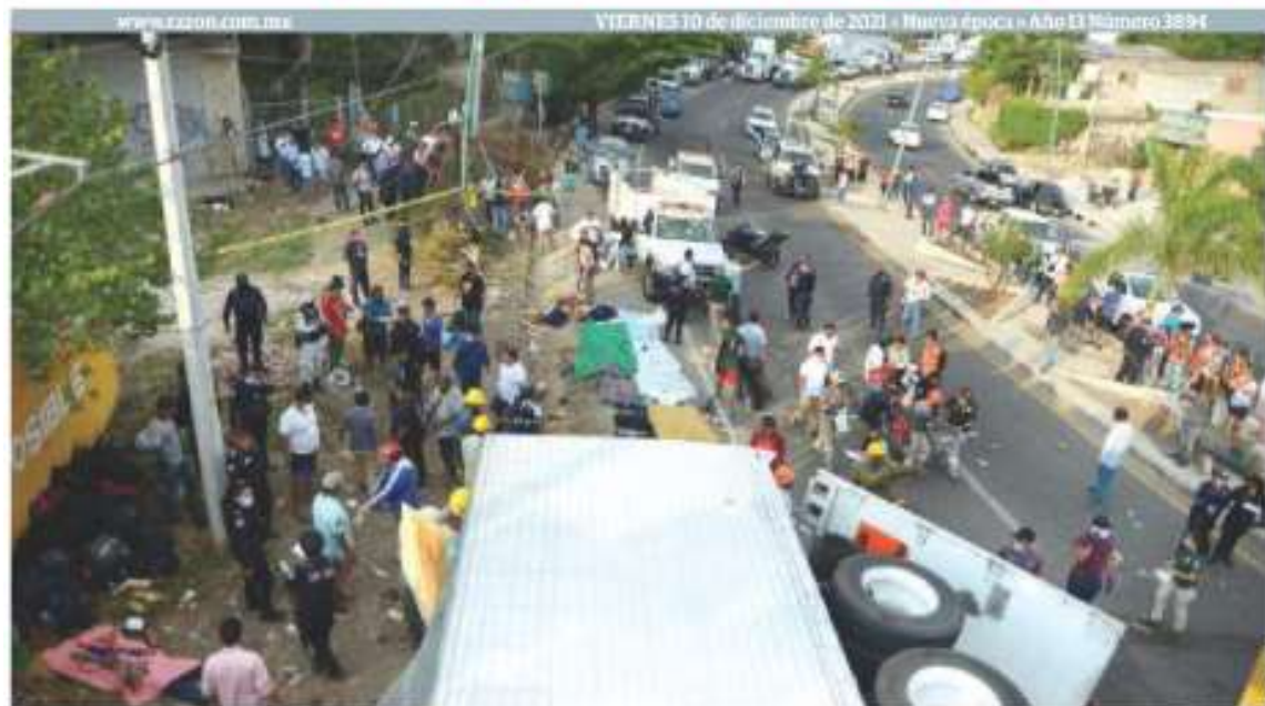
SITIO de la tragedia, ayer en la carretera de Chiapa de Corzo a Tuxtla Gutiérrez.