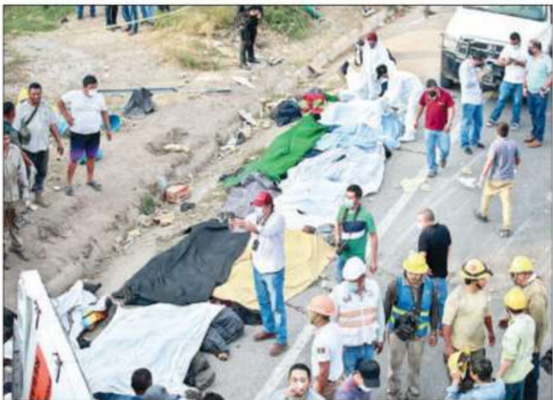
▲ Los primeros reportes señalan que viajaban apretujados en la caja del tráiler más de 150 migrantes, la mayoría procedentes de Guatemala y Honduras. El percance ocurrió poco antes de las cuatro de la tarde