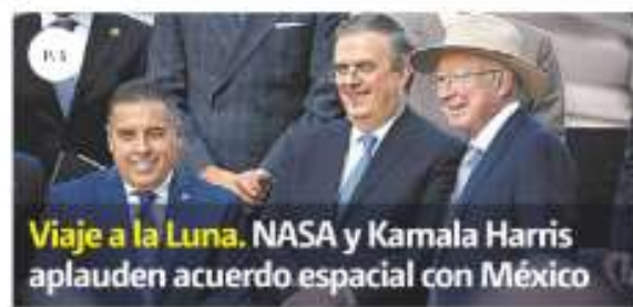
Viaje a la Luna. NASA y Kamala Harris aplauden acuerdo espacial con México