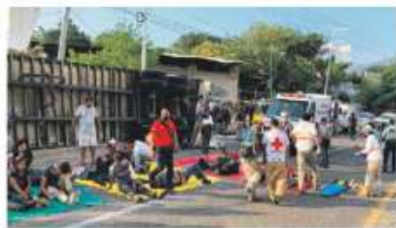
INM. Coordina esfuerzos para gastos funerarios y garantizar la repatriación.

Al menos 54 migrantes murieron y 105 resultaron heridos, varios de gravedad, tras volcar el tráiler donde viajaban. La unidad que circulaba a exceso de velocidad por la carretera Tuxtla-Chapa de Corzo, en Chiapas, perdió el control y se estrelló, lo que hizo que la caja, donde venían los migrantes, se desprendiera. La PGR informó que atravesó el caso. El presidente AMLO lamentó el accidente y la SRE informó que mantiene comunicación con los países de las víctimas. —Angele Martínez / PÁG. 42