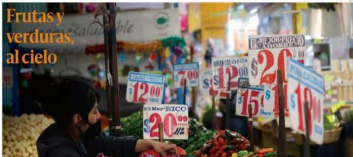
Entre los productos o servicios que más aumentaron sus precios están jitomate, tomate verde, chiles, pollo, luz eléctrica, carne de res, pollo, loncherías, torterías...