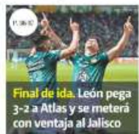
Final de ida. León pega 3-2 a Atlas y se meterá con ventaja al Jalisco

El Consejo Coordinador Empresarial anticipa un tercer paquete de obras de infraestructura y el Consejo de Negocios dice que expuso su respaldo a las energías verdes durante la cita en el Museo Kaluz. PÁGS. 20