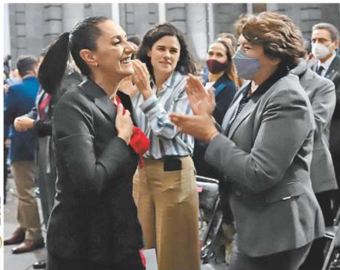
Las secretarías Federales de Educación, Delfina Gómez, y de Trabajo, Luisa María Alcalde, aplauden a Claudia Sheinbaum.

Escultura. Dalí y Rodin atisban en el corazón de la capital mexicana