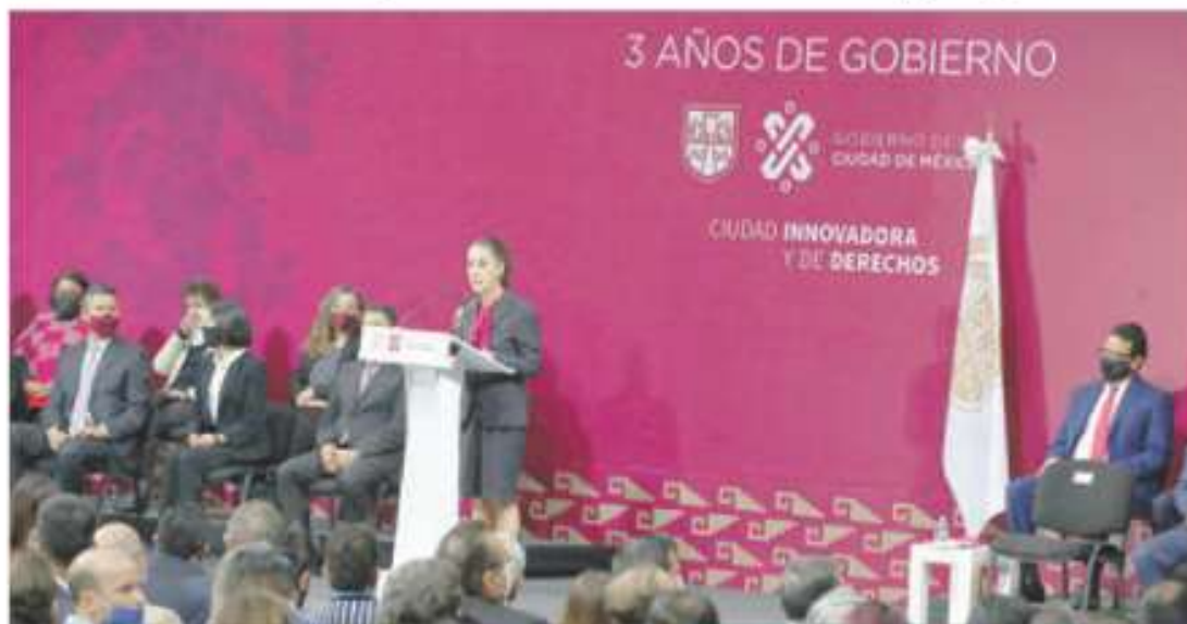
A Claudia Sheinbaum Pardo, jefa de Gobierno de la Ciudad de México, resultó en su informe de mitad de gestión que “la profundización de las desigualdades y la discriminación siempre llevarán hacia la violencia”.