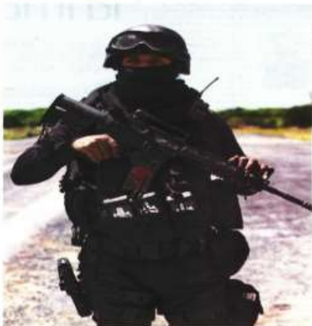
Esta corporación de seguridad usa como distintivo informal una calavera en armas y torturas. Se le acusa de ser el núcleo del grupo conocido en la zona de Piedras Negras.