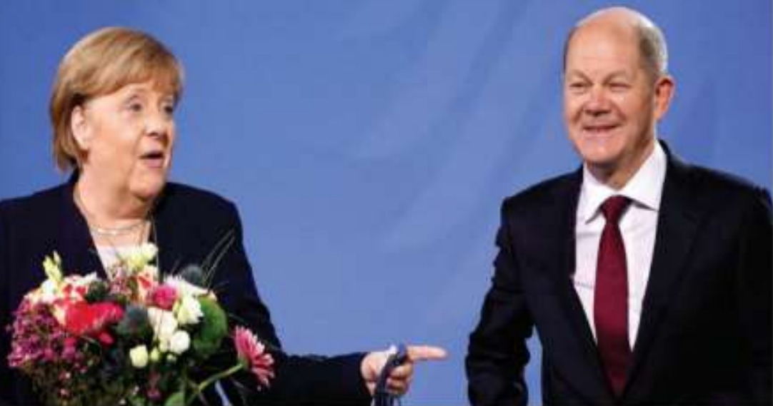
Alemania cerró ayer la era de Angela Merkel con la asunción del socialdemócrata Olaf Scholtz como nuevo canciller y toma el relevo de la mujer que ha liderado la primera economía europea durante 16 años. PÁGS 14-15

Enfrentar la pandemia, primer reto del nuevo canciller