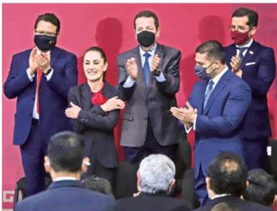
NUEVOS RETOS. Durante la rendición de cuentas a la mitad de su administración, Claudia Sheinbaum anunció 31 proyectos a concretar en 2022, entre ellos una nueva Línea de Cablebús en Chapultepec CDMX P. 7