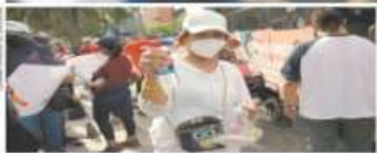
Escenas de reparto de ayuda se observaron en el AMLOfest para los estudiantes afectados en autónomos.