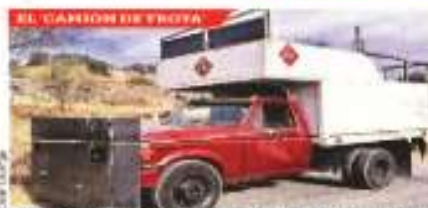
Los criminales usaron un camión repartidor de gas con una placa de acero para tumbar la puerta del penal.