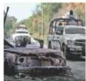
La fuga.

Con dos coches en llamas de anzuelos, un comando rescata a un líder huastecolero, por lo que ya hay seis detenidos. PÁGS. 12