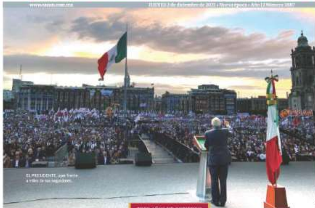
EL PRESIDENTE, ayer frente a miles de sus seguidores.