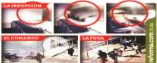
Los criminales usaron un camión repartidor de gas con una placa de acero para tumbar la puerta del penal.