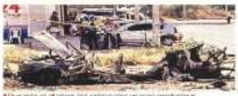
Durante el ataque, los criminales usaron explosivos para romper las puertas y causar confusiones en la zona.

TULA. En un operativo de policía, sicarios montados en un camión repartidor de gas distribuyeron la pólvora del penal de Tula. Los líderes del grupo criminal "Pueblos Unidos". Tras derribar el portón metálico con una protección de acero colocada sobre la defensa del camión, seis hombres armados ingresaron directamente a una zona vigilada, separada de las celdas del resto de presos, ubicada a la derecha de la entrada principal y se abalanzaron poco a ratillo de fugas. Poco a poco, ingresaron a las celdas y posteriormente con mucha calma a medida del tiempo. Los delincuentes pertenecen al grupo denominado "Pueblos Unidos", que controla el rubro de combusti-