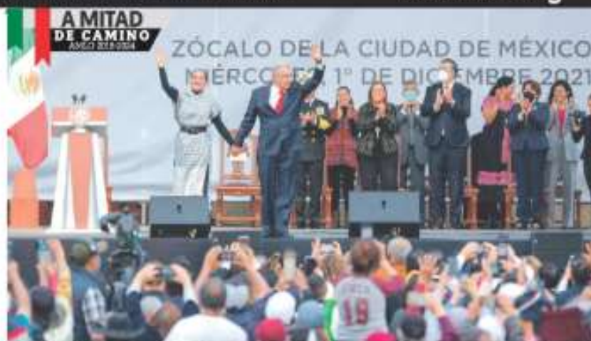
TERCERAÑO. El presidente entonó que ya "ho va a poder cambiar la conciencia que ha comido el pueblo de México".