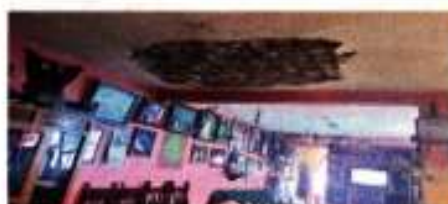
Vecinos reportan grietas y desprendimientos en sus casas.

Vecinos de 20 colonias de Ecatepec llegaron al lugar 60 años antes que existiera el Circuito Acapulco Mexiquense, pero desde hace 15 años cuando empezó a operar la autopista, los daños en sus viviendas se acumulan. El paso permanente de autos, camiones y tráileres provoca vibraciones que han terminado en grietas, fisuras y desprendimientos en las paredes, techos. Alcaldía, antes OHTL, es la concesionaria de la vía de cuota que conecta Cuautitlán Izcalli con Chetumal.