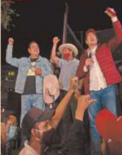
Luego de conocer el fallo, el presidente de Morena anunció que impugnará. ANTONIO ESCOBAR