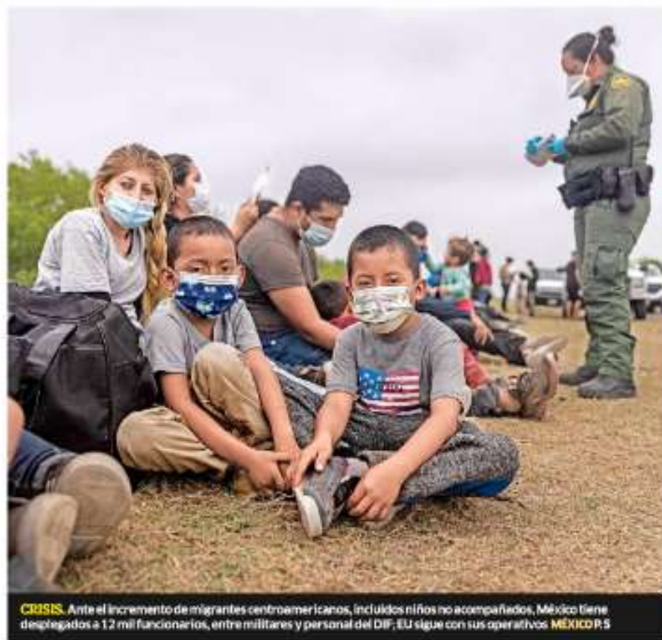
CRISIS. Ante el incremento de migrantes centroamericanos, incluidos niños no acompañados, México tiene desplegados a 12 mil funcionarios, entre militares y personal del DIF. EU sigue con sus operativos. MÉXICO P. 5

El INE confirmó por mayoría la cancelación del registro de la candidatura de Félix Salgado Macedonio y Raúl Morón por no cumplir con el informe de gastos de campaña. Afuera de la sede del órgano electoral, decenas de personas encabezadas por el político guerrerense abuchearon la resolución. Mario Delgado afirmó de inmediato que Morena impugnará ante el Tribunal Electoral. El presidente AMLO consideró que la sanción es por intereses creados y pidió luchar de manera pacífica MÉXICO P. 4