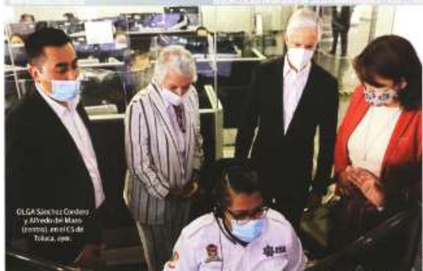
OLGA Sánchez Cordero y Alfredo del Mazo (centro), en el CS de Tabaca, ayer.

Primera unidad contra violencia de género VIA TELEFÓNICA atiende a mujeres de Edomex en casos de emergencia; clarín contertulios mientras interviene la policía pág. 4