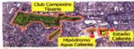
El Club Tiempo una extensión de 50 hectáreas.