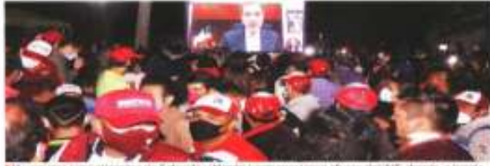
Morenistas y militantes de Salgado y Morena permanecieron afuera del INE, durante a través de una puerta, a la espera de la sesión de los congresos. Detrás, se retiraron de la plaza.

VEOTO 21 También hegan a Morena en Michoacán; 'es contra quien viola la ley', afirma Lorenzo Córdova ERENA HERNANDEZ y MARCO JIMENEZ