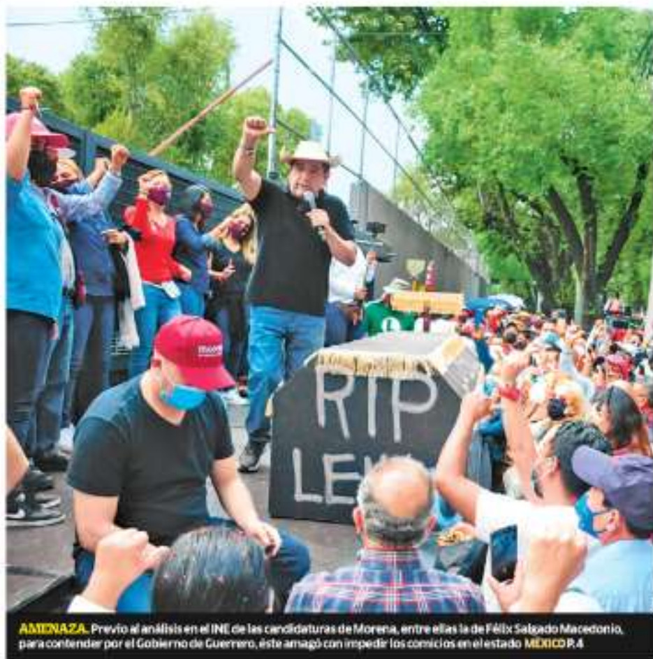
AMENAZA. Previo al análisis en el INE de las candidaturas de Morena, entre ellas la de Félix Salgado Macedonio, para contender por el Gobierno de Guerrero, éste amagó con impedir los comicios en el estado MÉXICO P.4

De enero de 2019 a marzo de 2021, el Gobierno federal ha dado de baja a un millón 155 mil 955 adultos mayores del programa de pensiones. Se complica el cobro porque no hay un día fijo para el pago, coinciden ancianos entrevistados. "¿Qué pasa con el dinero que ya no nos dan, a dónde se lo llevan?", pregunta uno de ellos MÉXICO P.3