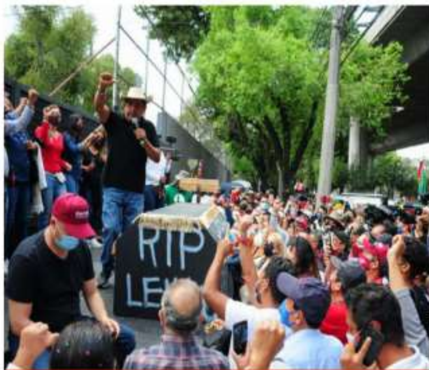
Félix Salgado Macedonio vuelve a plantarse frente al INE para exigir le devuelvan la candidatura o habrá consecuencias.

El morenista regresa con sus huestes al INE; anuncia que impugnará ante el TEPJF si no le regresan la candidatura