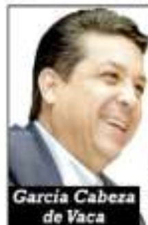
García Cabeza de Vaca