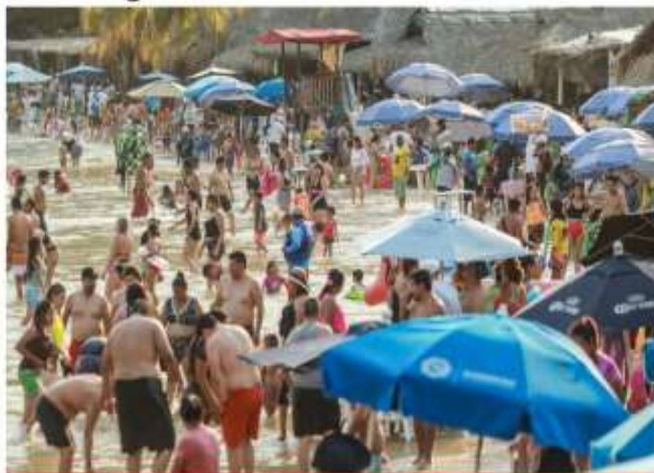
A pesar de la advertencia de que se aproxima la temida era COVID, miles de vacacionistas inundan las playas de Acapulco.

"El INE está sometido a una estrategia de amedrentamiento que no va a prosperar", dice el Consejero Presidente, tras el registro de candidaturas federales