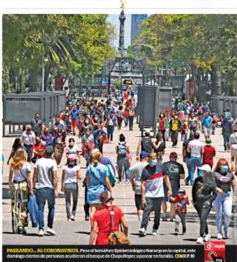
PASEANDO... AL CORONAVIRUS. Pese al Semáforo Epidemiológico Naranja en la capital, este domingo cientos de personas acudieron al bosque de Chapultepec a pasear en familia. COMEX P. 9

Gobernación, Salud y Presidencia negaron haber recibido solicitudes de funcionarios para que les adelantaran la aplicación de la vacuna, mientras el subsecretario López-Gatell reveló la existencia de cartas con esa petición. Birmex consideró confidencial el contrato para la Sputnik V y dio información incompleta sobre la compra de 3 millones de medicamentos para tratar el Covid... El Banco del Bienestar negó datos sobre sucursales construidas del 1 de enero de 2020 al 1 de febrero pasado MÉXICO P. 3