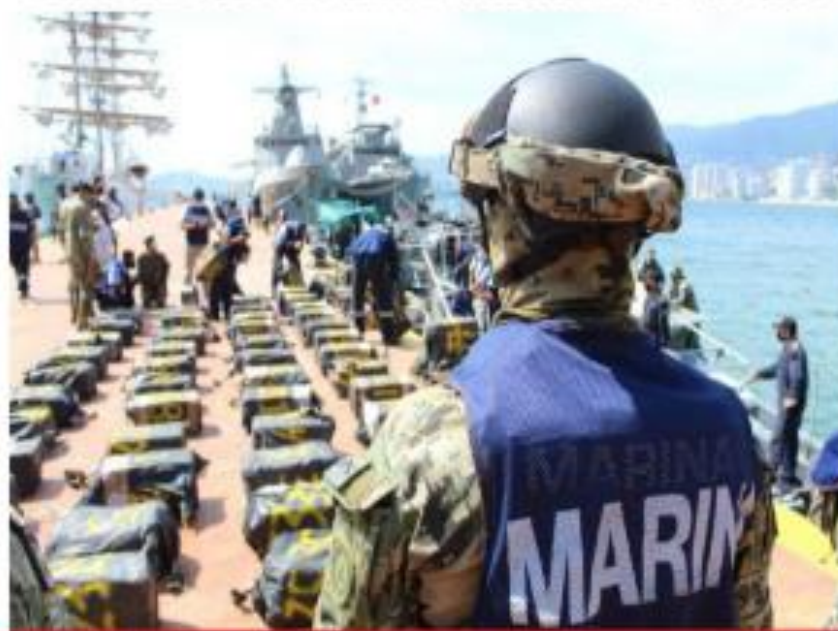
Elementos de la Marina aseguraron 55 bultos con cocaína con un peso aproximado de 2 toneladas, a 501 kilómetros al sur oeste del puerto de Acapulco. La droga tiene un valor de 548 millones 837 mil 500 pesos en el mercado negro.

DECOMISÓ LA SEMAR 2 TONELADAS DE COCAÍNA EN ACAPULCO