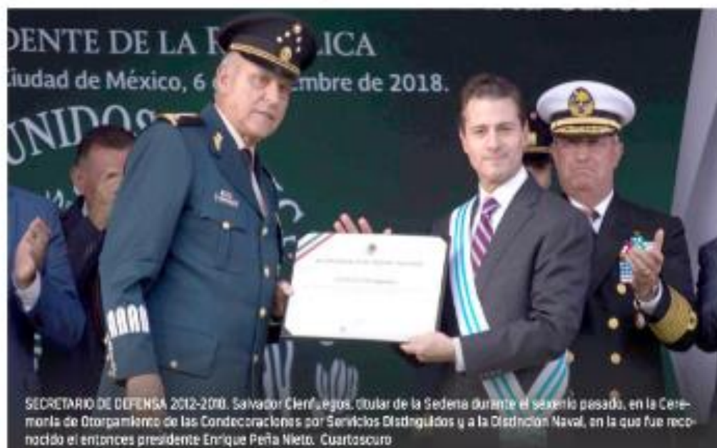
SECRETARIO DE DEFENSA 2012-2018, Salvador Cienfuegos, titular de la Sedena durante el sexenio pasado, en la Ceremonia de Dotamiento de las Condecoraciones por Servicios Distinguidos y a la Distinción Naval, en la que fue reconocido el entonces presidente Enrique Peña Nieto.

E l secretario de la Defensa Nacional en el sexenio de Enrique Peña Nieto, Salvador Cienfuegos Zepeda, fue detenido en el aeropuerto de Los Ángeles, informó el secretario de Relaciones Exteriores, Marcelo Ebrard. "He sido informado por el Embajador Christopher Landrau de EU que el secretario de la Defensa Nacional, Genl. Salvador Cienfuegos Zepeda, ha sido detenido en el Aeropuerto de Los Ángeles, California", publicó en Twitter. Previo a la confirmación del carrilero, la periodista estadounidense Ginger Thompson aseguró que la detención ocurrió cuando el general arribaba a la ciudad estadounidense con su familia. De acuerdo con versiones extraoficiales, la DEA solicitó la detención de Cienfuegos. Minutos después trascendió que el general está acusado de narcotráfico en modalidad de transporte y distribución de droga. Cienfuegos permaneció anoche en el Metropolitan Detention Center de Los Ángeles. Asimismo se destacó que la detención de Cienfuegos es resultado de una investigación de corrupción por un castillón que desde hace años años venía llevando a cabo el Departamento de Justicia de Estados Unidos. Pág. 12