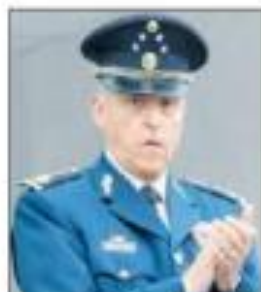
El general Salvador Cienfuegos estuvo al frente de la Sedena en el gobierno de Enrique Peña Nieto.