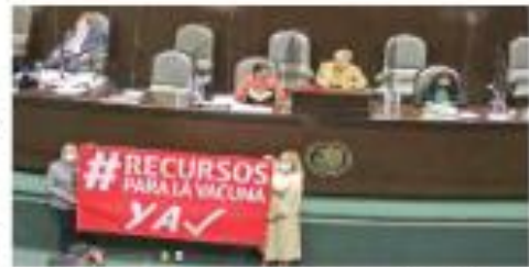
Diputados de oposición protestaron en el pleno para exigir que la compra de la vacuna no done una asignación presupuestal con crédito.