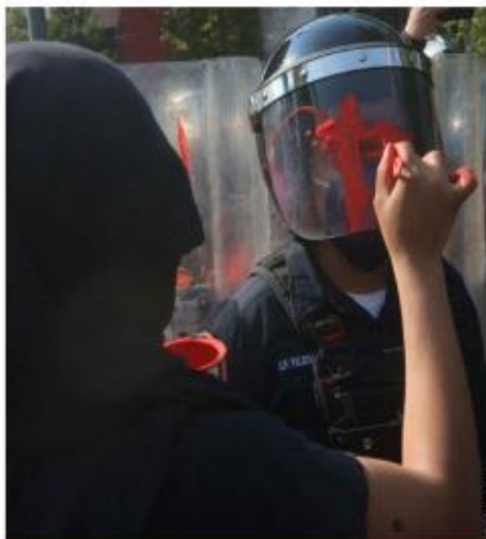
Mujeres encapuchadas protestaron así ayer en la colonia Roma contra la represión de policías a feministas en Cdmx.