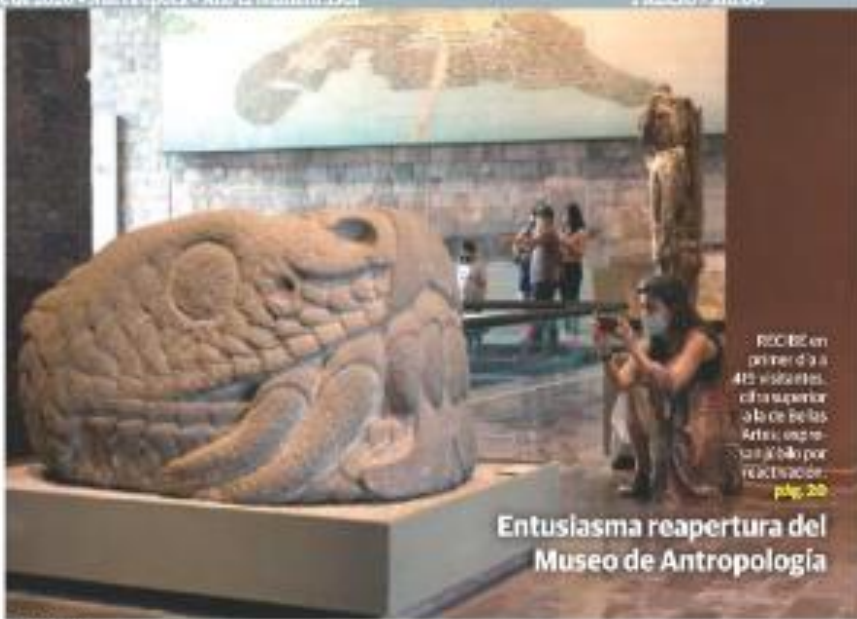
Entusiasmo reapertura del Museo de Antropología

El MIA en primer día a 415 visitantes, cifra superior a la de Bellas Artes, una razón: el bilbo por reactivación pág. 20