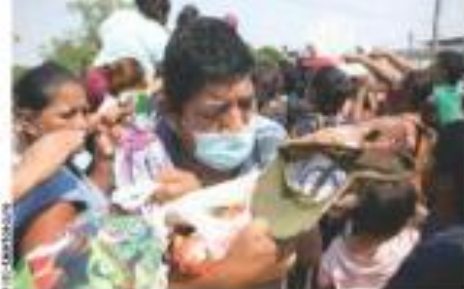
Reparto de algunas ayudas a damnificados, apor en Gobierno Sux.

"ESPERO QUE NO LE DÉ RISA EL SUFRIMIENTO DE LOS TABASQUEÑOS", ADÁN AUGUSTO A BARTLETT