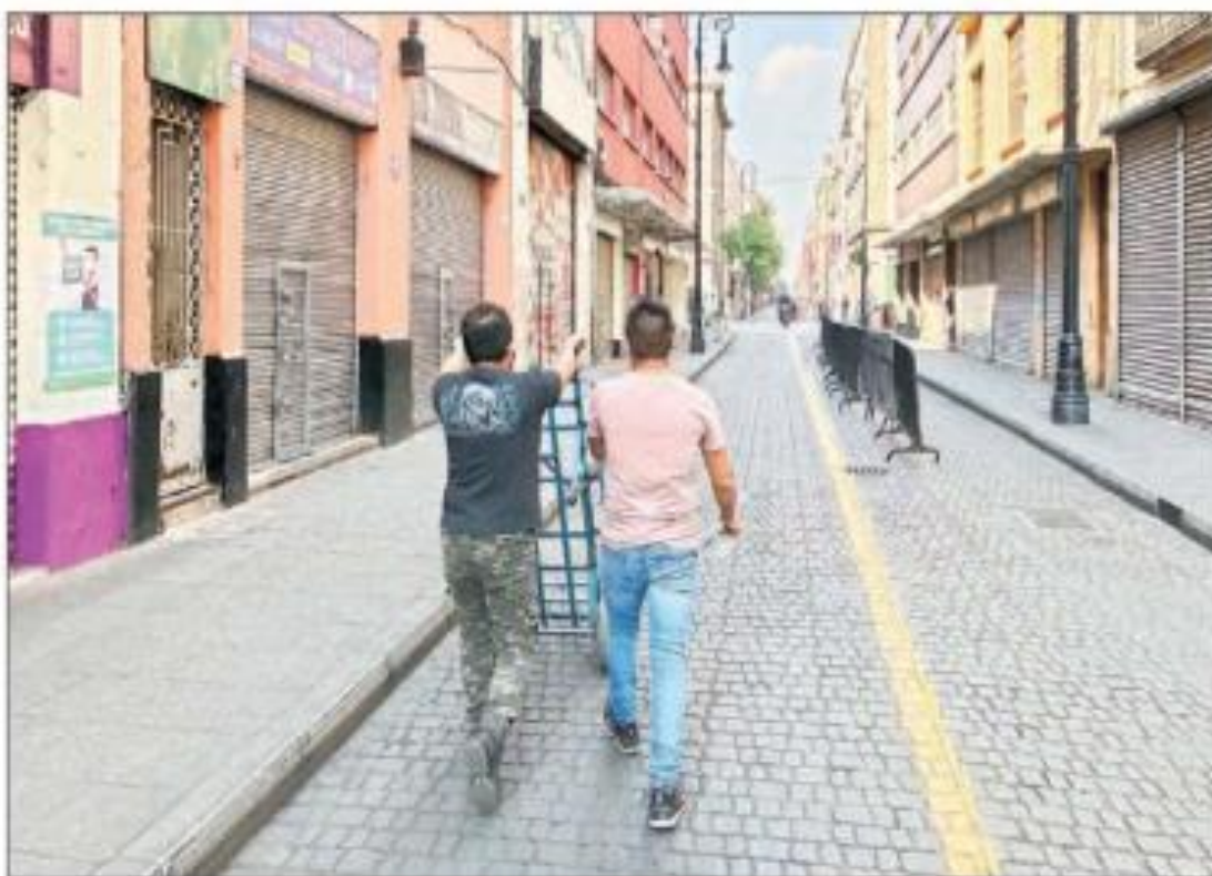
▲ El reforzamiento de acciones del gobierno de la Ciudad de México en el Centro Histórico tras el retorno del semáforo rojo epidemiológico tuvo ya efectos en calles donde días atrás hubo aglomeraciones por las compras navideñas; la imagen es en Correo Mayor.

● Pfizer, Moderna y AstraZeneca slistan pruebas para confirmar eficacia ante la mutación