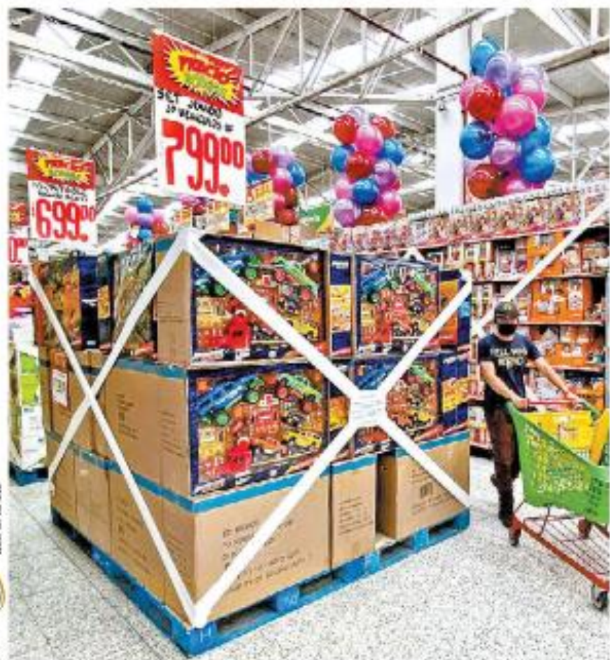
Por una confusión, algunas tiendas frenaron la venta de juguetes, que luego reanudaron. CLAUDIO TORRES

Coalición opositora PAN, PRI y PRD se alían para "frenar" a Morena en 2021 CAYLOR BERG - P. 67