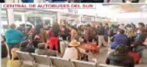
CENTRAL DE AUTOBUSES DEL SUR