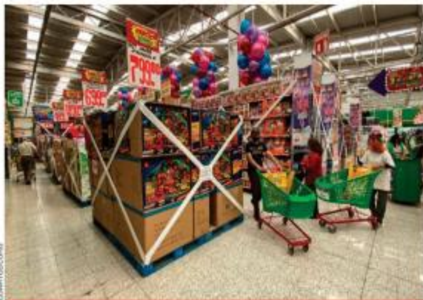
En algunas tiendas del Valle de México a los juguetes les dan el mismo trato que a los licores. Está prohibida su venta, que por "disposición oficial". Olvidan que en Navidad estos productos son esenciales para los niños. 13

PAN, PRI y PRD formalizan acuerdo de alianza parcial para las elecciones federales de 2021