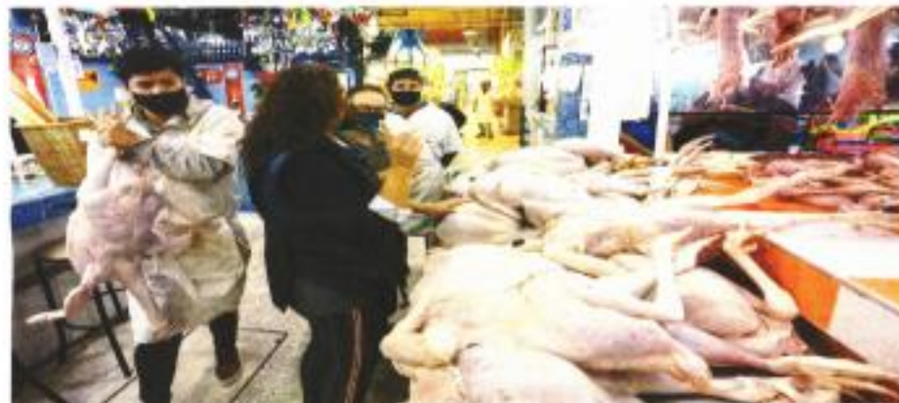
El Covid-19 no amarga el espíritu navideño de los capitalinos, que van al mercado de San Juan para comprar el pavo que cocinarán el 26 de diciembre.