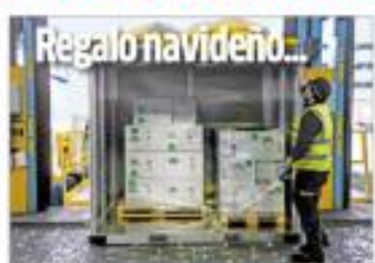
La agencia sanitaria europea decidió en 27 días si aprueba la sustancia de Pfizer-BioNTech; y podrían aplicarla horas después MUNDO P.15