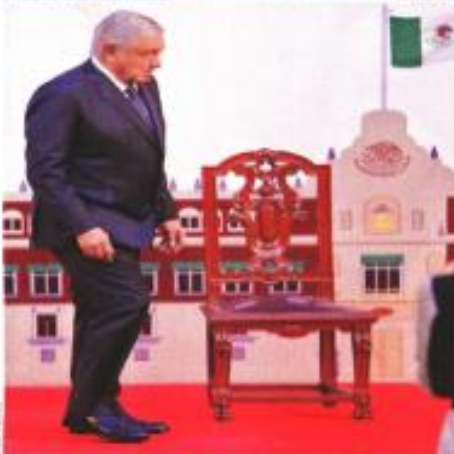
SALIENDO DEL HOYO. México tardó fondo en abril pero ya sale de la crisis, dijo ayer AMLO en Palacio Nacional.