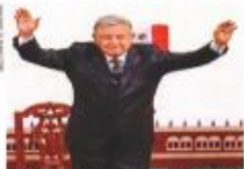
El Mandatario dijo que su gobierno procura que a simple vista se le vea un éxito visible.

ALERTA MUNDIAL COVID-19 EN MÉXICO 1,122,362 CASOS CONFIRMADOS 106,765 MUERTOS