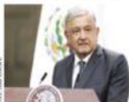
Andrés Manuel López Obrador. Mensaje por dos años de gobierno.

Reconoció como pendientes el homicidio doloso, los feminicidios