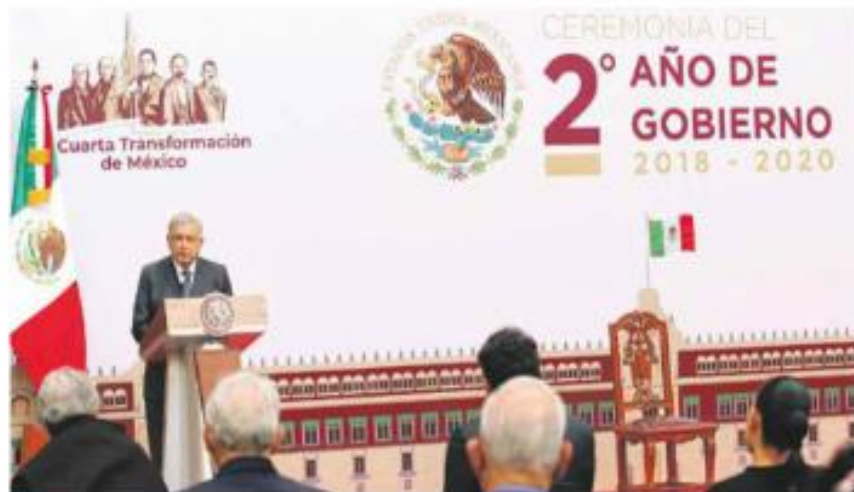
EMPLEO. AMLO destacó que al menos se ha recuperado la mitad de los trabajos perdidos por las restricciones de la epidemia.

Sobre la pandemia de Covid-19, dijo que tras recibir un sistema de salud “en ruinas”, consiguió crear nuevos hospitales, reconvertir otros, acondicionar más camas generales y con ventilador, y tener el apoyo de hospitales privados. “No nos hemos visto rebasados”.