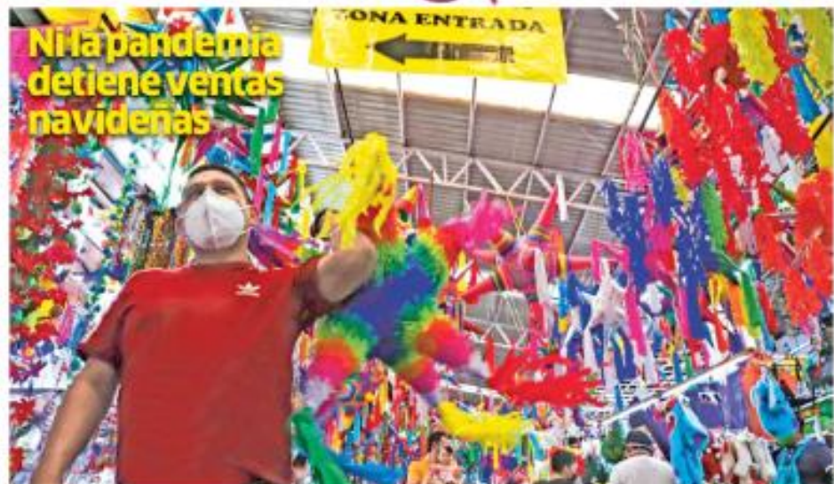
El Mercado de Jamaica, uno de los centros de abasto más tradicionales de la Ciudad de México, famoso por la venta de arreglos florales, luce con bastantes visitantes pese a la pandemia de Covid-19, debido a la temporada de productos navideños. CDMX P.9

"EN MI GOBIERNO NO HAY IMPUNIDAD", AFIRMA AMLO