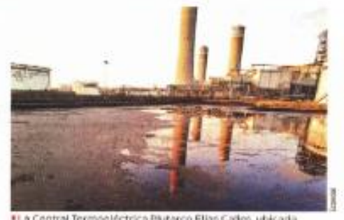
En la Central Termoeléctrica Petacalco Elias Cabret, ubicada en el municipio de La Unión, Guerrero, registró la semana pasada un derrame de aceite que llegó hasta la bahía.