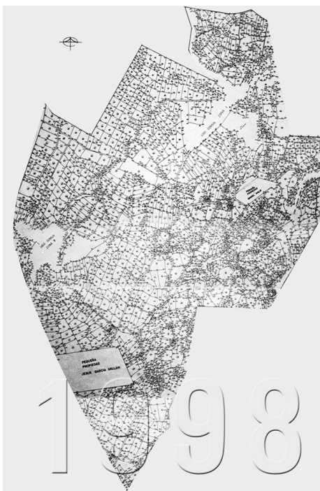
Ejido La Presita en 1998

En otras palabras, para que las mujeres tengan acceso a la tierra, cuando por más de 70 años han estado excluidas de toda posibilidad (a menos que hayan sido viudas jefes de hogar y reconocidas por el cuerpo jerárquico ejidal), ellas tendrán que comprarlas en el mercado de tierras, pues difícilmente los varones aceptaron registrar sus parcelas a nombre de sus esposas, hermanas o hijas. Para ello no sólo deberán de contar con ingresos propios suficientes sino encontrar tierras disponibles que se les quiera vender, eso sin contar con la dudosa calidad de la tierra.