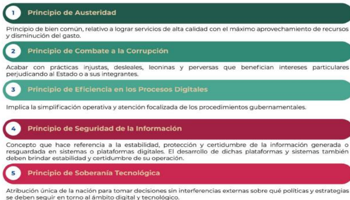
Figura 1. Principios de la EDN

La EDN aterriza las capacidades gubernamentales en la prioridad de atender los planteamientos de una adecuada gobernanza tecnológica, la mejora de los servicios digitales y la optimización de los procesos, enmarcando dichos propósitos en los siguientes principios: